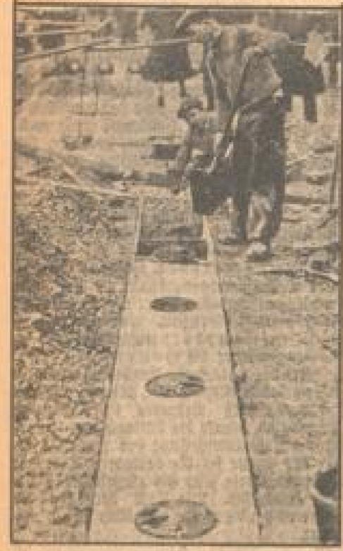
Einige reflektierende Straßensignale in Paris, welche sich als sehr wirksam erwiesen haben.