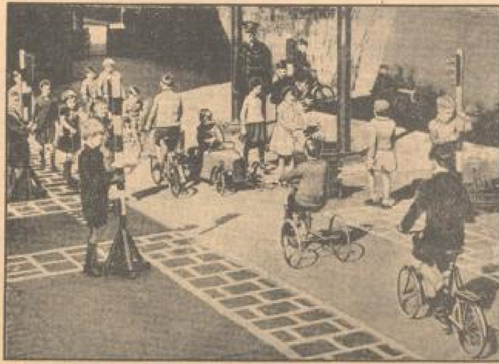
Der Schulung in der Verkehrsschule in New York werden durch praktische Übungen für den modernen Verkehrsverkehr gelehrt. Auf dem Schulhof ist eine Straße angebracht, die von Kindern aller Art und von Schulkindern geleitet ist. Ein Verkehrswacht überwacht die Bewegungen und prüft die Verkehrsregeln.

technischen Zeitalter hat man sich das Zeichnen längst angewöhnt. Noch vor wenigen Jahren war es eine Sesseltat, wenn ein Pilot über den Atlantik flog, heute sieht man in den Zeitungen nur noch ganz selten von dem regelmäßigen Luftverkehr über den Atlantik von Europa nach Südamerika. Wenn am 18. April von Grouard aus das Verkehrsflugzeug nach Mexiko fliegt, kann leicht sein eine der letzten Flügen im weltumspannenden Flugnetz. Noch vor wenigen Jahren war man überglücklich, daß gerade diese Fluglinie wegen ihrer Geschwindigkeit (sogar nicht geflogen werden kann, aber das hat Vorteile) in möglichst geringer Zeit zum nächsten Land in noch nicht einmal 24 Stunden um den halben Erdball reisen.