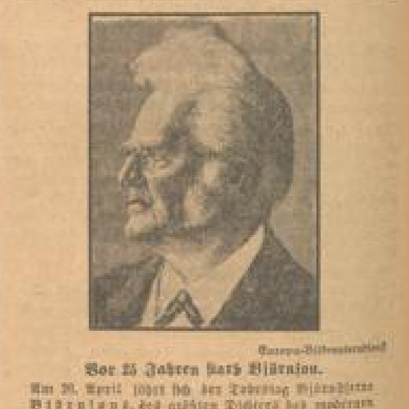
Vor 25 Jahren ...