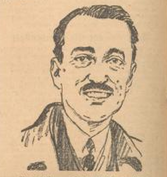
Schwedischer Zuerstflieger lobt Olympiaanlagen

Gruppe 4 Mannheim: VfR Mannheim — VfR Weinstadt; 2:1. Köln: VfR Köln — VfR Köln; 2:1. Worms: VfR Worms — VfR Worms; 2:1. Heidelberg: VfR Heidelberg — VfR Heidelberg; 2:1.