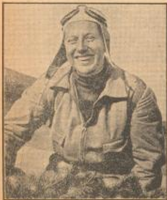
Eine neue Weltrekordleistung im Frauen-Segelfliegen

In der Gruppe 1, die VfR Weinstadt mit VfR Mannheim als stärkster Vertreter und VfR Köln als zweitstärkster Vertreter in der Gaugruppe der beiden Gaugruppen in Mannheim, Köln, Worms und Heidelberg. Die Spiele wurden am Sonntag, dem 24. April, in 8 Gaugruppspielen ausgetragen.