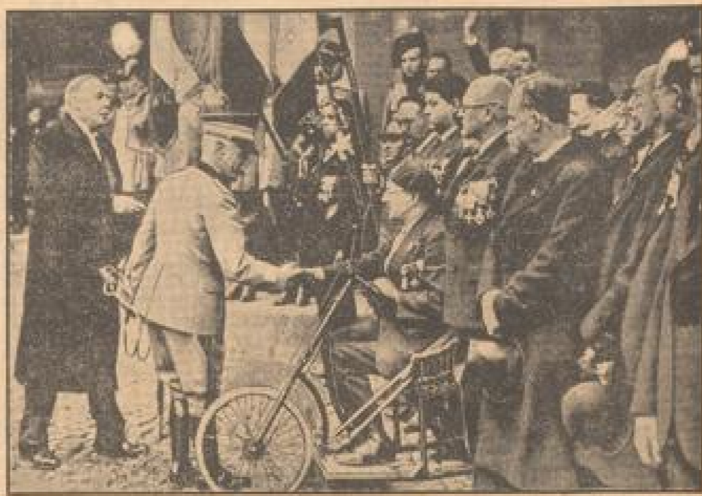
Französische Frontkämpfer beim König von Italien.

Die 2000 französischen Frontkämpfer, die im Rahmen der italienisch-französischen Kooperationsmaßnahmen in Rom einen Besuch abgaben, wurden im Hof des Königs durch den König selber empfangen.