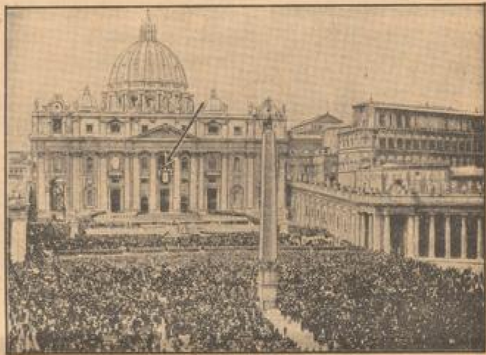
Oberfeier in Rom

Die 2000 französischen Frontkämpfer, die im Rahmen der italienisch-französischen Kooperationsmaßnahmen in Rom einen Besuch abgaben, wurden im Hof des Königs durch den König selber empfangen.