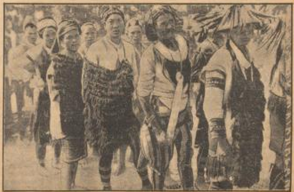
Eingeborene der Insel Formosa.

Nur dem Tempelhof ist, auf dem am 1. Mai der Bau des nationalen Reichstages veranstaltet wird, werden schon jetzt umfangreiche Vorbereitungen getroffen. So werden unter dem Reichstagsdach riesige Tribünen für die 214 000 geliebten Reichsbürger errichtet.