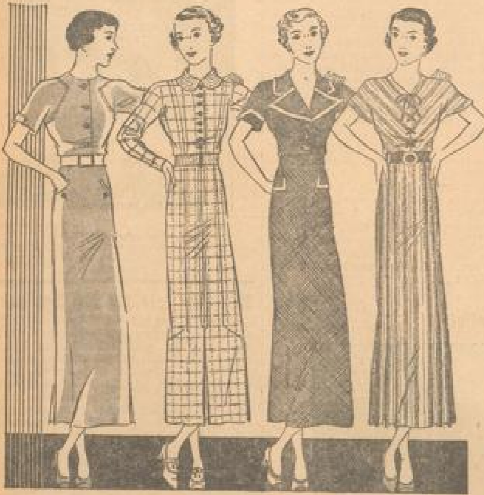
Durch einen neuartigen Einheitsstil ist schon... Die Kleider in beige... Garnituren Sommer... Einzelstück, in ganz...

Vorher den hohen Dreiermanteln werden Kostüme mit kurzen, gleichfalls sehr locker liegenden Sandalen gezeigt. Sie sind einfarbig zu karierten Röcken oder einfach zu einfarbigen. Dieser Gegenstand der beiden Stoffe wird durch den Belag der Kuffschläge mit dem Stoff des Rockes noch hervorgehoben. Sie werden um an den Knopf erst geschlossen müssen, nachdem wir so lange Zeit nur die anliegende Rockim-Jude konnten. Aber das geht, wie die Erklärung lehrt, meist recht schnell, zumal unser Auge durch die Dreiermantel bereits auf eine leise Weise eingeleitet ist.