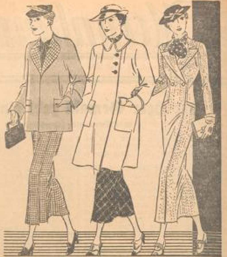
Der neue Geschmack für alle Tage kehrt sich leicht und leichten Mod und neuartig lein, einleuchtende Leichte, Hülsen-Schnittmuster S 12408

Zum Alltagskleid gehört ein sportlicher Mantel mit einem hübschen Schal, ein ruhiger Laufmantel ohne viel Teum und Dean, Herrentasche, Schieber, Klappen, Klappen sind keine Kennzeichen. Statt der langen taillierten oder gerührten Rollmantel kann es jedoch ebenso einer der beliebten lässigen Dreiermantel in Wollstoff sein. Hier ist neben Welle das beste Material am Plat. Soll der Mantel guten Schutz gewähren, wird man ihn hochgeschliffen, mit einem Vordruck von drei Knöpfen nicht unter dem Kragen, wählen. Keinesfalls dürfen die heute unerlässlichen Taschen fehlen. Mit Überallschleppen ausgelegt erreichen sie oft eine respektable Größe.