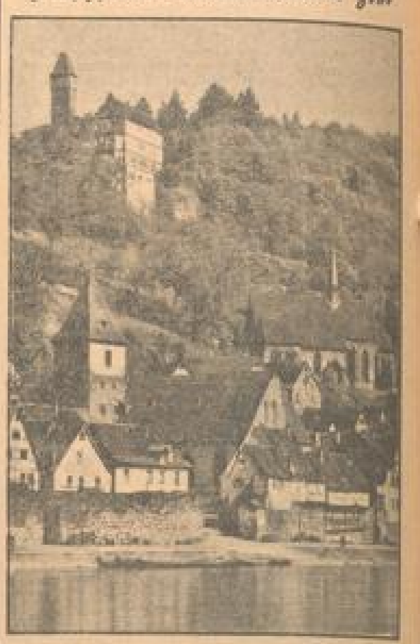
Immer mehr neue Entwürfe die alte Stadt am Neckar... Immer mehr neue Entwürfe die alte Stadt am Neckar...