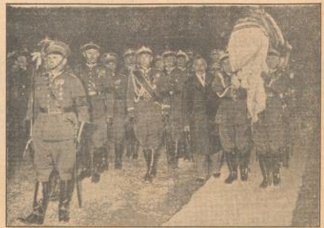
Die nächtliche Heberführung, Marschall Pilsudski zur St. Johannes-Kathedrale. In feierlicher Prozession wurde in Warschau der Leichnam des Marschalls Pilsudki von Soldaten der St. Johannes-Kathedrale überführt.