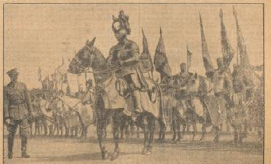
Das Mittelalter wird wieder lebendig. Im Rahmen der Festlichkeiten aus Anlaß des zehnjährigen Jubiläums wurde in Nürnberg ein großes mittelalterliches Fest veranstaltet, von dem unter Bild Heinrich VIII. ein Bild zeigt. (Gemeinschaftsarbeit)

aus der allen großen Redigierbarkeit seiner Opfer verdankte es der Welt, daß seine Gesetze für ihn zu einem recht interessanten Geschäft wurden.