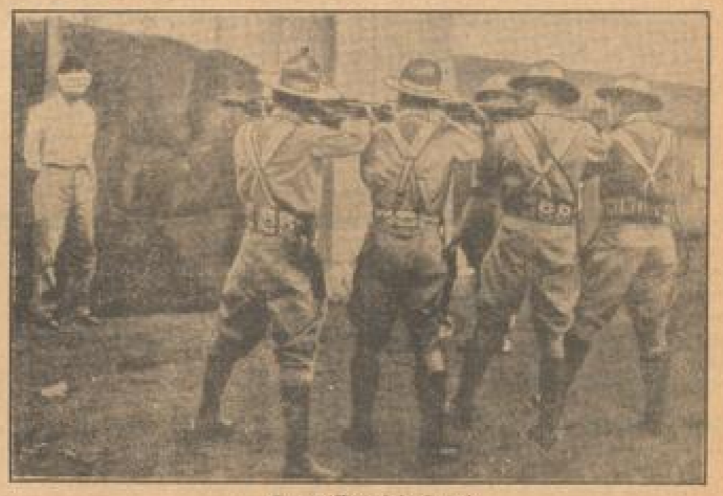
Kurzer Prozeß in Kuba! Ein Wüstentier und Kuba, eines der jetzt unruhigsten Länder Amerikas. Die Verhaftung eines indischen Mannes, der im Kampf zwischen Kuba und Spanien einen indischen Freund tötete.