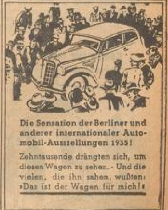
Die Sensation der Berliner und anderer internationaler Automobil-Ausstellungen 1935! Zehntausende drängten sich, um diesen Wagen zu sehen. Und die vielen, die ihn sahen, wußten: »Das ist der Wagen für mich!«