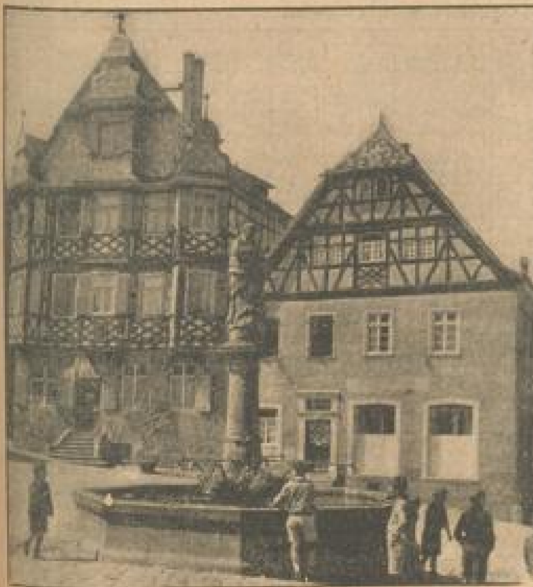
Der wundervolle Fachwerkbau der Heppenheimer Apotheke ist eines der schönsten Häuser rings um die liebliche Mutter Gottes auf dem Marktplatz.

Erst in den letzten Jahren ist hier wie überall das alte Gut so großer Überlieferung wieder recht eingeschätzt und seiner eigentlichen Bestimmung gemäß gepflegt worden. Und wer durch Heppenheim romantische Gassen wandert — wer das im Kurfürstentum zusammengesprochene heimatspezifische Liede dieser entzückend altertümlichen Stadt umweilt der babylonischen Örtlichkeit betrachtet und endlich nach einem guten Trunk ein Heppenheimer Stein-Häcker, Schloßberg oder Radeberg mit der Dunkelheit auf dem zum Beispiel geräucherten Marktplatz einkehrt, der wird solchen „Weg in die Vergangenheit“ gewiß nicht zu bereuen haben. M. S.