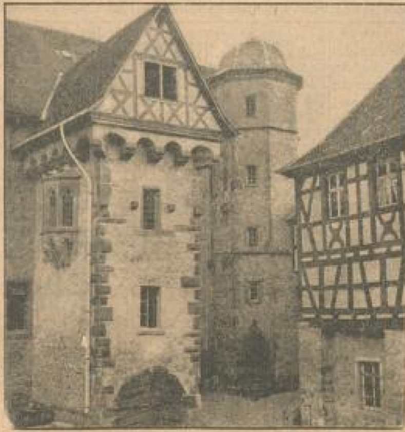
Ein Wahrzeichen einstiger Fürstenherrlichkeit ist der Karmeliter Amtshof. Links der Kapellenturm mit prächtigen gotischen Ornamenten, 1508.