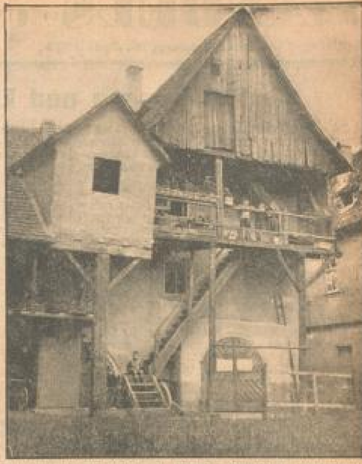
Ein romantischer Winkel im Hof der ehemaligen Posthalterei. Die Stiege hinauf ging's in die heute noch bewohnten Kutscherstube.

dem fünfzehnten Stadtbrand von 1500 wieder auszubauen anfang, während sein Nachfolger Wolf von Rappolt die Errichtung neuer Stadtmauern, Ausgestaltung des Amtshofes und manche andere kulturelle Zeit in einem weiteren Jahrzehnt zu Ende führte. Eine große Stunde des alten Kurfürstentums mag es auch gewesen sein, als hier im Jahre 1483 der Mainzer Erzbischof Dietrich als Kaiser des Heiligen Römischen Reichs Deutscher Nation vereidigt wurde und dem Kaiser Sigismund den Treueeid ablegte.