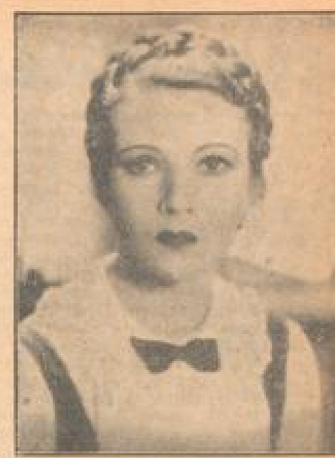
Kannella in dem Film „Kannella“, der hier gezeigt wird.

Wer möchte sich auch? Wer möchte sich, in seinem Haus einen Jungen oder ein Mädchen auf einige Wochen zu sich zu nehmen?