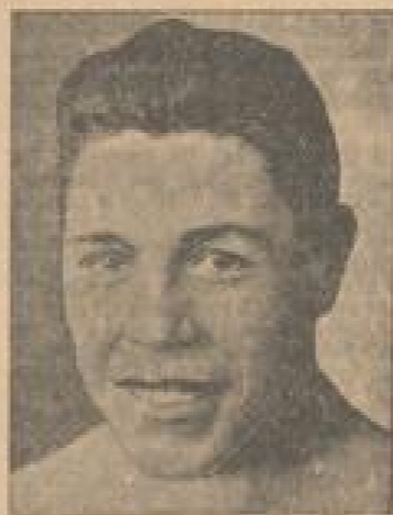
Der Europameister Charles Brüggen

Der deutsche Hockensportler hat in London einen Sieg errungen. Die besten Hockensportler sind die Spieler der Hockensportler-Spielzeit in der Schweiz, die im vergangenen Sommer bei der Hockensportler-Spielzeit in der Schweiz verlaufen ist.