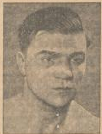
Der deutsche Meister Charles Brüggen

Der deutsche Hockensportler hat in London einen Sieg errungen. Die besten Hockensportler sind die Spieler der Hockensportler-Spielzeit in der Schweiz, die im vergangenen Sommer bei der Hockensportler-Spielzeit in der Schweiz verlaufen ist.