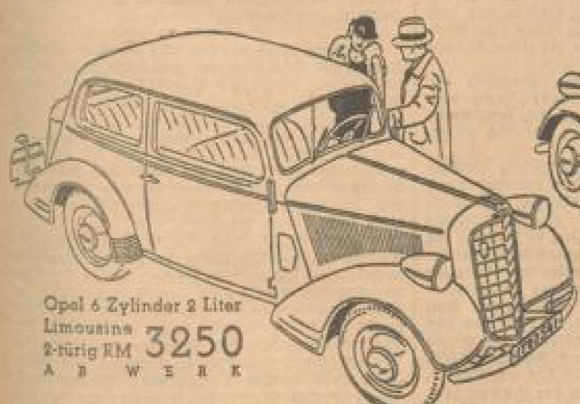
Opel 6 Zylinder 2 Liter Limousine 2-türig RM 3250 A B W E R K

Opel erweitert das Programm seines 6 Zylinder-Typs um 3 neue Karosserie-Modelle: eine zweitürige Limousine für RM 3250.- eine Cabriolet-Limousine für RM 3350.- eine vierfenstrige Cabriolet für RM 4300.- Dieses umfassende 6 Zylinder-Programm insgesamt 8 verschiedene Wagenformen ermöglicht Ihnen jetzt die Auswahl des Modells, das allen Ihren besonderen Wünschen entspricht, mit den unerreichten Vorzügen des Opel „6“: „Opel Synchron-Federung“ Geräumigen, von innen und außen zugänglichen Kofferraum Tiefe Schwerpunkt lage Stoßfreie Lenkung, unabhängig von der Federung Ungewöhnliche Geräumigkeit Unerreichte Leistung.