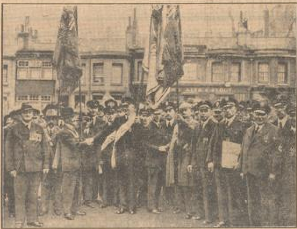
Edenkreuz und Union Jack Der ehemalige deutsche Kriegsbefehlshaber wurde bei seiner Ankunft in Brighton (England) von Vertretern der großen englischen Flottenkommandos „British Empire“ auf deren Einladung bei einer feierlichen Begrüßung empfangen.

Paris, 21. Juni. Die englisch-französischen Besprechungen, die um 11.30 Uhr am Canal d'Orleans begannen, dauerten bis um 13.15 Uhr und wurden nach dem Frühstück fortgesetzt. An den Besprechungen nahmen teil: Minister Eden, der englische Botschafter, der Vizekonsul und ein Vertreter des Foreign Office sowie auf französischer Seite Ministerpräsident und Außenminister Laval, der Wehrminister Desmarest, der Kanal-Präsident, der Wehrminister des Canal d'Orleans, Segier, und der Oberste Ruffin. In dem Frühstück erlaubte der französische Außenminister Laval die Besprechung der auswärtigen Angelegenheiten von Frankreich und dem Kanal. Eden und Laval legten den Standpunkt ihrer Regierungen dar, der im wesentlichen folgendermaßen lautet: