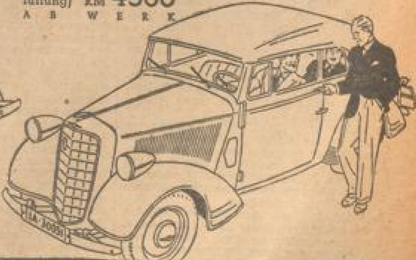
Opel 6 Zylinder 2 Liter 4-fenstriges Cabriolet (mit zugfreier Entlüftung) RM 4300 A B W E R K

OPEL 6 ZYL 2 LTR LIMOUSINE 4-TÜRIG RM 3600.- * OPEL 6 ZYL 2 LTR CABRIOLET 2-FENSTRIG RM 4000.- AB W E R K ADAM OPEL A. G. RUSSELSHEIM A. M.