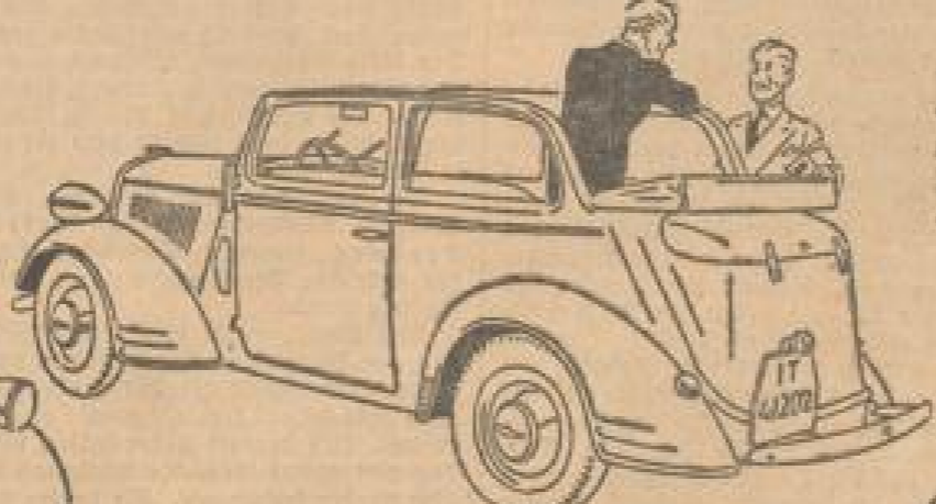
Opel 6 Zylinder 2 Liter Cabriolet-Limousine RM 3350 A B W E R K