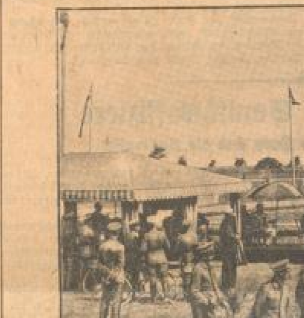
Die Reitervereine reiten in Eberbach

Die Reitervereine reiten in Eberbach. Die Reitervereine reiten in Eberbach. Die Reitervereine reiten in Eberbach.