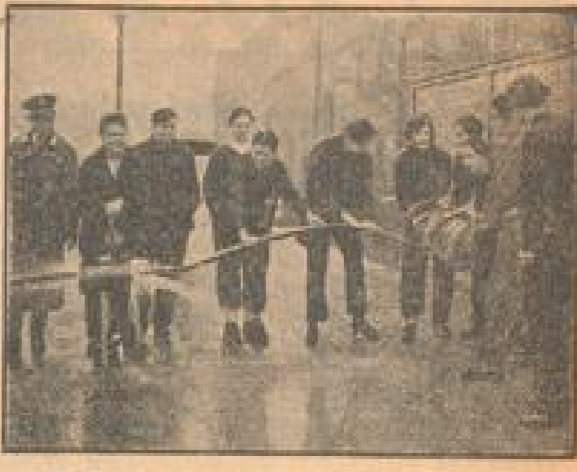
Ein Straßensprengung bei manchen feiner Ecken

Rundfunkhandel wird für diese Maßnahmen besonders dankbar sein, da durch die Auswertung der unzuverlässigen Elemente das allgemeine Vertrauen in den Rundfunkhändler gestärkt werden kann. Der RRM legt Wert darauf, daß von den Rundfunkhändlern und Mitarbeiterinnen sofort gemeldet werden, Gerade die Mitarbeiterinnen des RRM sollen durch ihre Mitarbeit beim RRM einen gewissen Schutz gegen Überforderungen und Überarbeiten finden.