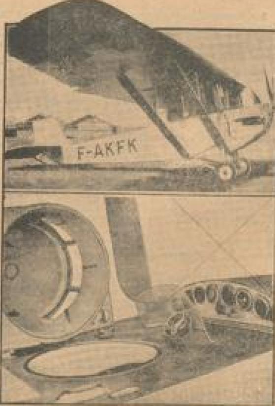
Das französische Strahlpfeifenflugzeug abgeführt