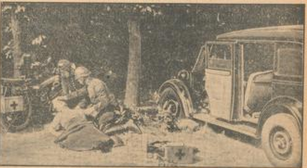
Frankreichs Landkrieger-Polizei als Samariter