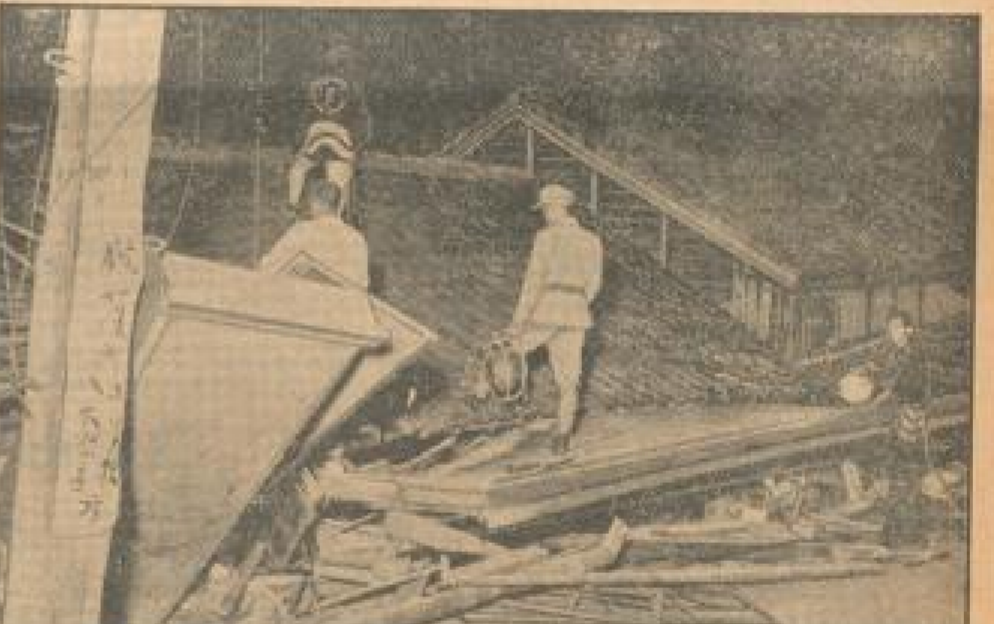
Ein Bild vom letzten Erdbeben in Japan