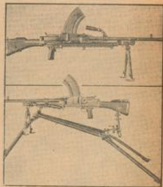
England führt ein schwedisches Maschinengewehr ein