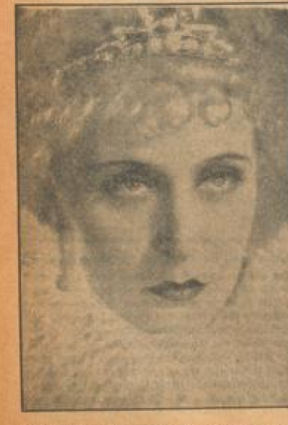
Seine Majestät der Kaiser... Portrait of a man

Am 18. August, die 18. August, auf der Olympischen Ringkutschbahn in Berlin... Reise nach Berlin