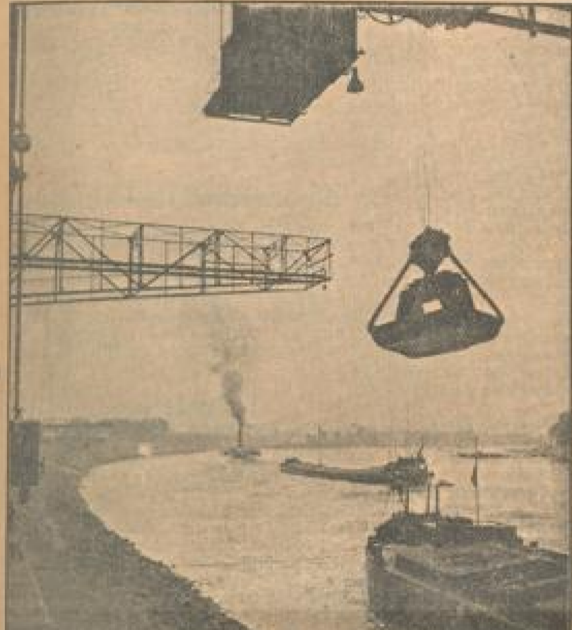
Kohlenkrieger auf dem Rhein bei der Mannheimer Landstadt.

geworben eine über das ganze Jahr verteilte, andauernde Braunkohle ihren Brennstoff haben. Man muß sich aber nur einmal recht klar machen, welchen Anteil an der gesamten deutschen Wirtschaft die Kohleergänzung und Rohkohlenverarbeitung einnimmt, um diesen immer wieder ergehenden Nachdruck richtig verstehen zu können. Denn die Rücknahme der herabgesetzten Sommerpreise ist in Wahrheit nicht nur zum Vergessen getroffen worden, sondern soll auch als Anreiz dienen, um mit Hilfe der verbündeten wirtschaftlichen Spannungen auszugleichen.