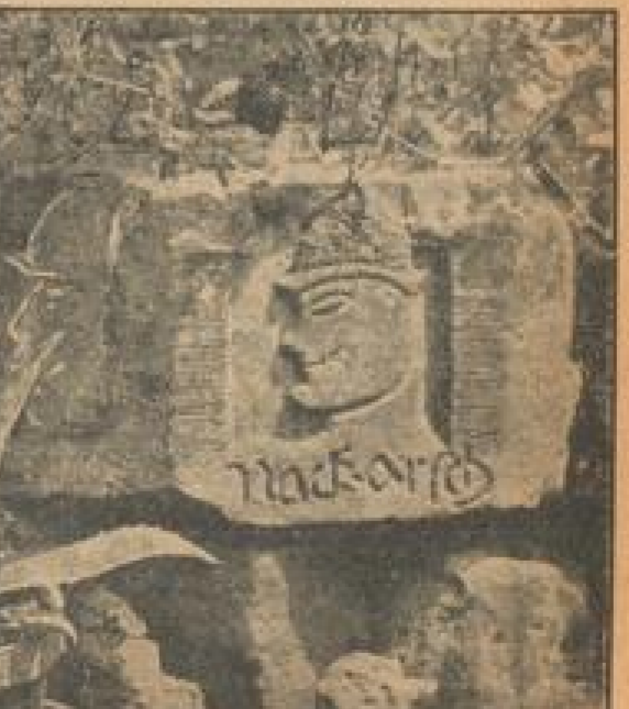
Dieser originelle Schlußstein mit seinen Fratzen zeigt von dem volkstümlichen Humor des hiesigen Steinmetzen

Und ist schon das Entzerrten auf den Feldern sehr vorüber, sind Schreierinnen und hochbeladene Wagen aus der Landschaft verdrängt, so bietet eine heikale Stelle durch Pfälzer Wälder und Mauern an jedem der kommenden Spätsommermonate wieder neue Fäden und Töne, aus denen uns das Lied von der Mutter Erde in vielstimmiger Melodie entgegenklingt, um unserer eigenen Wochenarbeit noch solchen Erleben Schwung und Rhythmus zu verleihen.