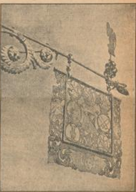
Der prächtvolle Schild des einstigen Zunft-Wirtshaus zeigt an, wie viele Zünfte in Neuleiningen sesshaft waren

wiedererwachter Freude an den Schönheiten der engeren Heimat und den überlieferten Traditionen ihrer Vergangenheit viele neue Freunde gewinnen müßten, deren Begeisterung für das alte Vergnügen und seine Geschichte auch die Schwerkrieger einer wirtschaftlichen Notzeit überbrücken helfen könnte.