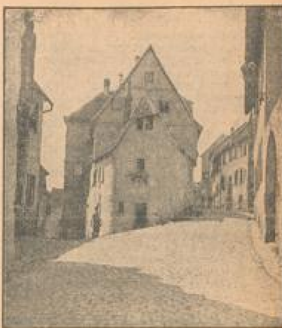
Unberührt vom Wandel der Zeiten liegen die winkligen Giebelhäuser im Morgensonnenschein

vergangen Seiten sich verlor. Das ganze Städtchen mit seinen jetzt allerdings nur noch 800 Einwohnern scheint noch immer wie in einem Tornadoschweif befangen, der es in seiner sanftigen Eigenart erfaßt hat. Da kann man vom Innenhof des südlichen Turmes auf das Gemälde des abfallenden Turm und großer Fächer, auf die in ihrer Schönheit so wunderbare gotische Werke mit dem Ruchlein und schlichten Franzosenzeiten, auf gewundene Stiegen, Eiser und manchen anderen Frauen Hierat der wüchserigen Wälder, während sich jetzt der Fächer und Mauern des Abends die der Stadt und die mit Dörfern und Städten überzogene Ebene hinzieht. Vor hundert Jahren etwa, als die Herrschaft der Leiningen Grafen und des schon seit dem 14. Jahrhundert mitbühnenden Wormser Erzbischofs durch den napoleonischen Rheinbundakte der Vereinigung der Pfalz an Frankreich übergeben wurde, ist ein Neuleiningen Schloßherren Quantities der Ruine geworden und bei sich eben jenen südlichen Turm als Wohnung angebaut und die feste Feste seiner drei