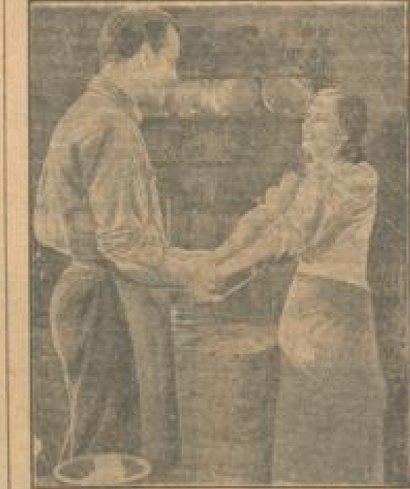
Das Heilige und ihre Mare

hebung dieses schönen Volksliedes und die ottische Hochzeiten, die u. a. auch Aufnahme vom Godesheimer Rotarodromen bringt.