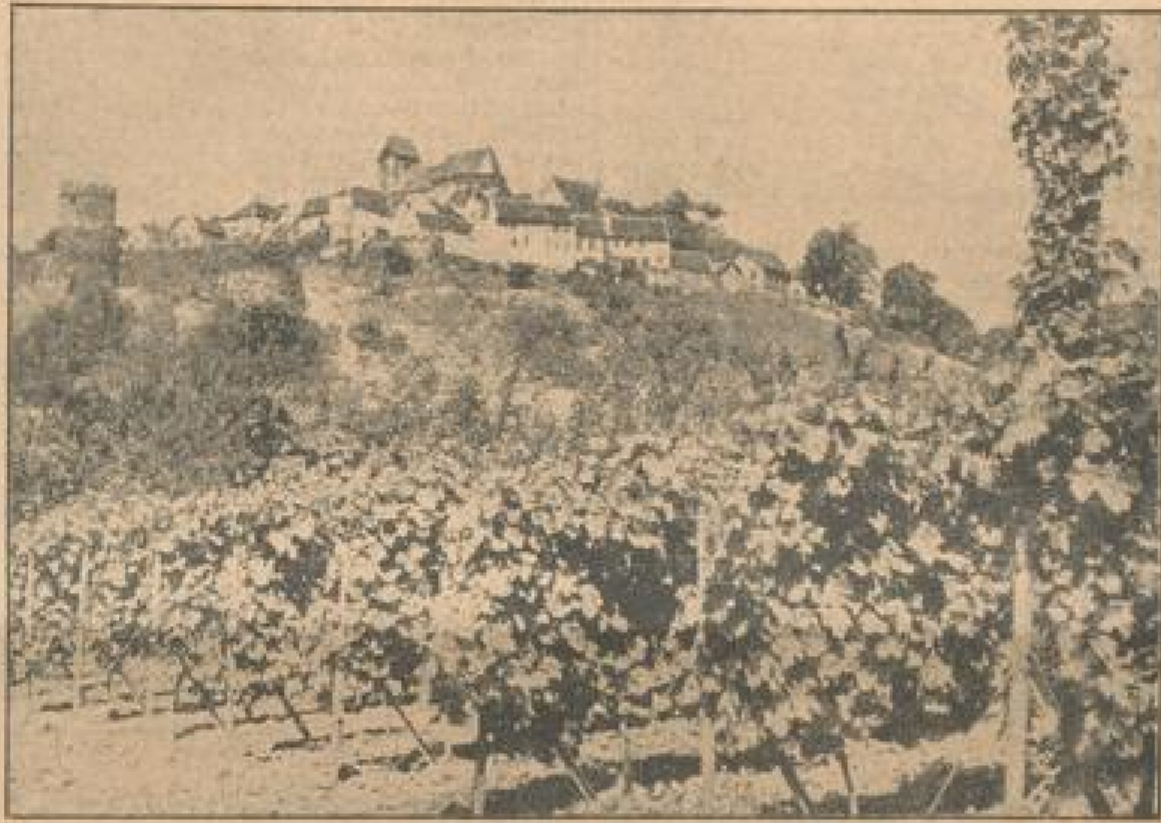
Pfälzer Landschaft von einzigartigem Reiz: Von der Kuppe des rebenbewachsenen Hügels gründen die Mauern und Türme der alten Stadt

„Wo warum nicht Fremdenverkehr?“ fragt man etwas erstaunt, weil trotz schönstem Sommerwetter selbst am Sonntag das hübschere und behaglichere alte Wirtshaus mit seinem in die Stadtmauer hineingebauten Biergarten über die Straße hin menschlicher ist. „Ja, warum nicht Fremdenverkehr?“ „Ist denn uns halt keiner?“ meint betrübt der Wirt, dessen seltenes altes Panzschild mit einem ungewöhnlich schönen Schmiedeeisernen Schildträger am Wand allein die Einfuhr verleiht. Kaum mehr als dreißig Kilometer vom Paradies, auf ausgereinigten Straßen selbst für „gemächliche“ Radfahrer mit Kind und Kegel bequem zu erreichen, liegt ein leichtes, doch blumiges Weinchen von den durchflanzten Bergkuppen unterhalb, aus denen alle Vorzüge des Sonnengutes atmen — und das sollten sich die Mannheimer auf die Dauer eingeben lassen? Alles spricht dafür, daß die Neuleiningen in unseren Jahren