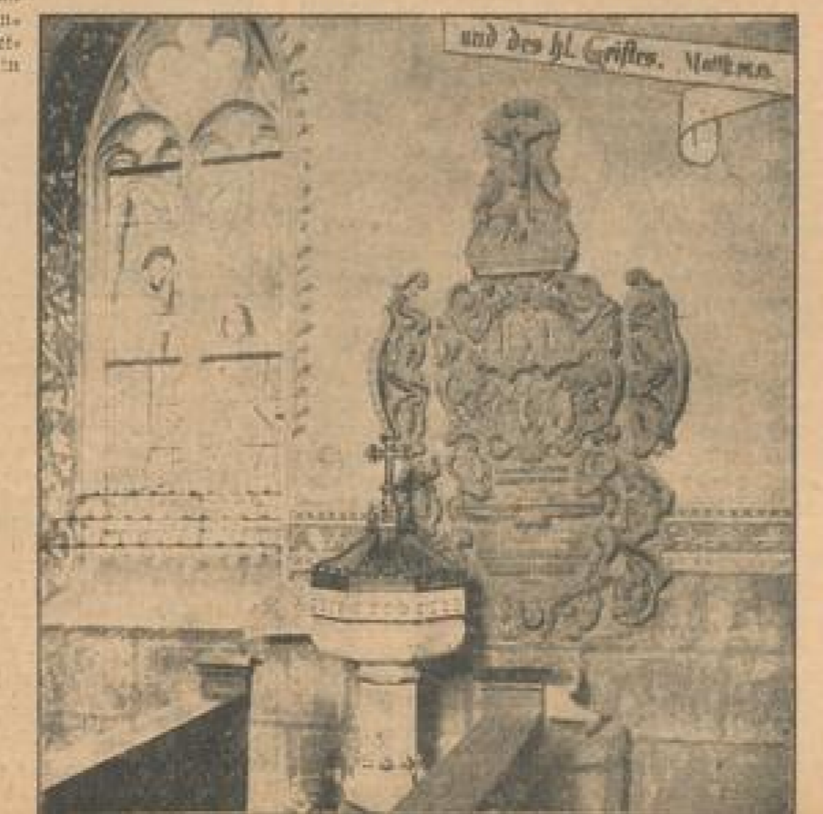
Ein besonderer Schmuck der gotischen Kirche ist der schöne Renaissance-Epitaph des Grafen von Wachenheim in der Taufkapelle