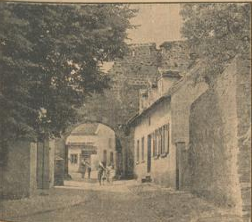
Durch das nördliche Tor, an der mächtigen Linde vorbei, führt der Weg nach Grünstadt

Dah es den Neuleiningern aber inmitten all ihrer besagterenden Romantik nun gerade gut ginge, kann man selber nicht behaupten; denn ihre langjährige Gemeindegemeinschaft, die Stimmenschrift drinnen im Tal, ist vor nicht langer Zeit beseitigt worden, so daß Tausende von gelehrten Juristen und Sozialwissenschaftlern selbst einwirkend sind. Wohl gibt es inmitten des Städtchens an der Grundhader Straße eine Pfalzkapelle, deren Schornstein in bedauerlicher Weise die herrliche Landschaft verunstaltet, aber auch sie kann gleich einer noch immer aus dem wunderbar goldgelben Sandsteinbrücken bestehenden Ostermühle der Ruchleinheit nur wenigen Arbeit geben.