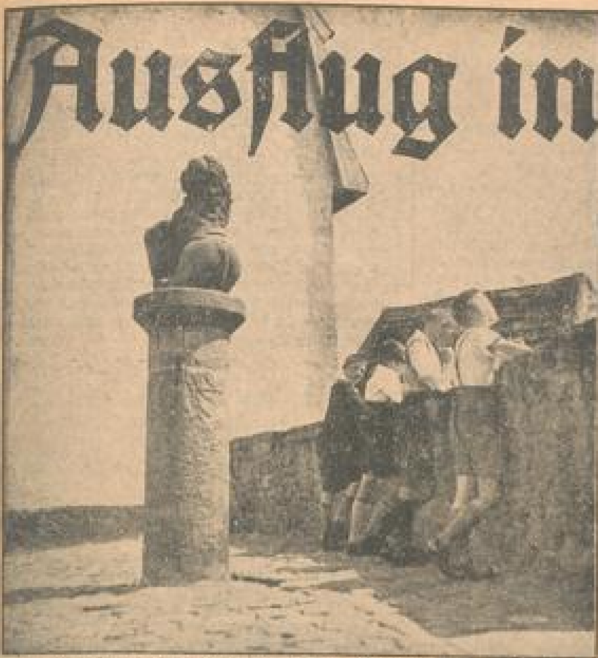
Wie vor Jahrhunderten blickt der steinerne Wappenlöwe über die alte Stadtmauer ins Weite

Die pfälzische Burgfestung Neuleiningen, ein malerisches Erbe deutschen Mittelalters