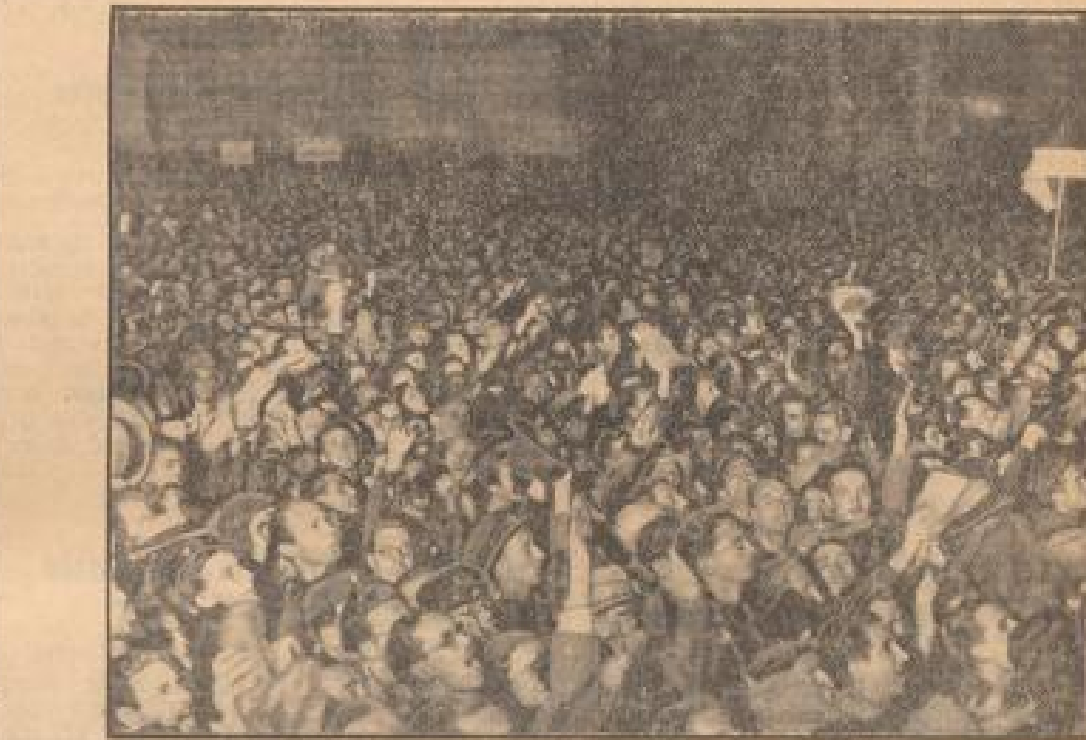
Der große Platz von der großen Opernschau in Italien, zu dem auf Befehl des Duce 30 Millionen Mann antrafen, um die Unabhängigkeit Italiens zu feiern.

Italien würde zu diesen Verpflichtungen in einem Geiste der Zusammenarbeit ohne irgend eine unbedachte Absicht, sich von dort zurückzuziehen, beitragen, falls es nicht durch die Stellungnahme anderer Völkerbundmitglieder zu einem solchen Schritt gezwungen werde.