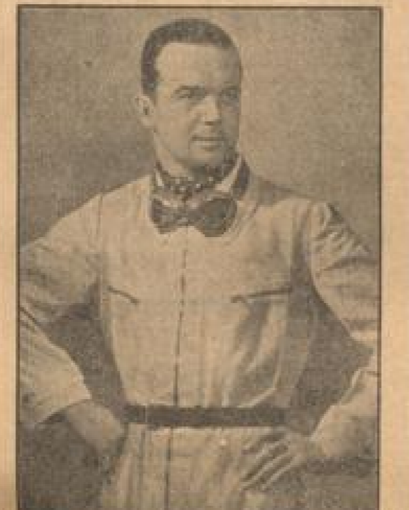
Rudolf Caracciola - Europameister 1935

Neues deutsches Rennen: Preis der 11. Olympiade - Terminkalender der IFA IFA. Report on a racing event.