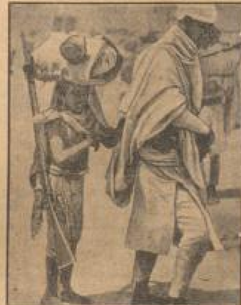
Der Sohn als Gewehrträger

Bei einer flugtechnischen Versuchsreihe in Vöcklabruck, die mit einer Höhe von 10 000 Metern durchgeführt wurde, wurden neue Erkenntnisse erzielt. Der „Himmelstisch“ ist ein Tisch, der in der Höhe von 10 000 Metern aufgestellt wurde. (Waldth, M.)