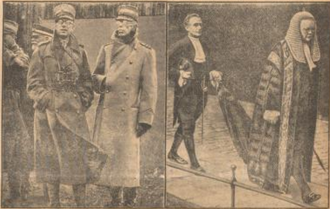
Der König von Schweden beim Manöver

In Berlin-Mitte befindet sich die deutsche Versuchsanstalt für Luftfahrt, in der mit Hilfe eines riesigen Windkanals die notwendigen Versuche mit Hingängen und Flugzeugmodellen durchgeführt werden. Hier zeigen links des Bildes im großen Windkanal. Der den Luftstrom erzeugende Propeller hat den gewöhnlichen Durchmesser von 10 m und wird durch einen 200-PS-Motor angetrieben. Rechts sieht man den Prüfling im Innern des Windkanals mit einem Hilfsmittel in der Hand. Darüber befindet sich eine riesige getriebene Waage mit den Messgeräten. (Berthold Weidemann, M.)