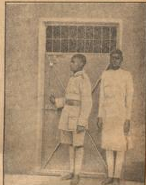
Das neue abessinische Staatsgeländnis

Ein Bild von der italienischen Mobilisierung. Das Bild zeigt den Sohn eines Bauern, der als Gewehrträger ausgebildet wurde. (Waldth, M.)