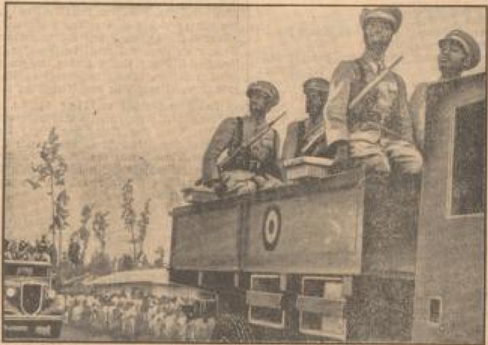
Nach Erfolg des Abessinienfeldzugs hat in der abessinischen Grenzstadt eine große Truppenparade stattgefunden. Auf dem Bild ist eine Abessinierin im Vordergrund zu sehen, die einen Soldaten durch ein Auto transportiert.