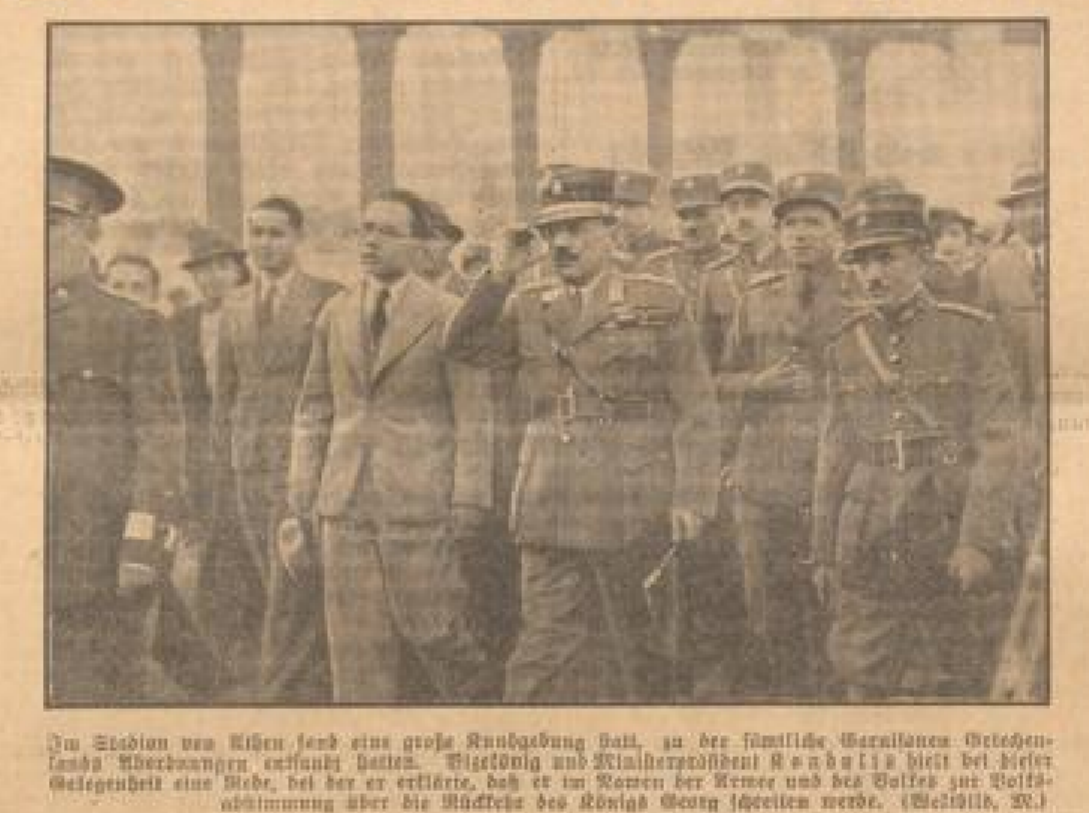
In Station von Kien fand eine große Kundgebung statt, zu der sämtliche Wehrmänner...