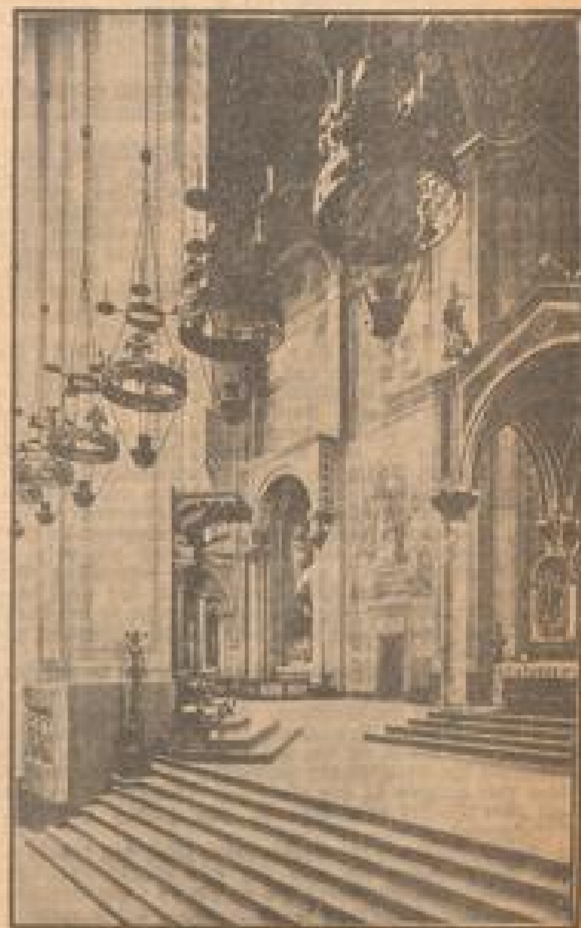
Weißenhof II das Innere des Speyerer Doms