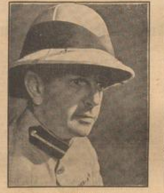
Volambo als Hauptfigur...