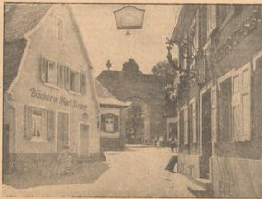
Blick in eine malerische Straße der alten Neckarstadt

Wegen der Delfkrüge von Neckargemünd, die früher die ganze Umgebung im Schmucke, schon von Goethe (auf einer seiner Schweizer Reisen) als „reinklich“ bezeichneten Delfkrüge mit Del verfertigt, tragen die Neckargemünder bei ihren näheren und ferneren Bekannten den Namen „Delfkrüge“. Wie wäre es, sagte damals in dem Kreise des Verkehrsverbands ein Teilnehmer, wenn die Neckargemünder keine Delfkrüge als Reiseandenken fertigen lassen? Geht, geist — dachte der tüchtige Wagnermeister von Neckargemünd — und erinnerte sich an moderne Köpfermeister, in der Tat sollte Collage zu denken. Die ersten dieser originellen Reiseandenken und Gedenkstücke, die jedoch aus der Werkstatt des Neckargemünder Köpfers kamen, waren aus hellem Zinnober. Auch hier mußte es auch natürlich nicht unbedingt — Del in den Reaktionen sein! Und die Arbeit von der Arbeit: Man muß nur wollen und ein wenig Geschick haben, um die Arbeit zu leisten, dann lassen sich auch in einem Tage anziehende und beziehungsvolle Reaktionen schaffen. Obendrein kann auf dem in Neckargemünd beizubehalten Weg aus manchem Handwerksbetrieb Arbeit angefertigt werden, die über traditionelle ein wenig hinwegführt. Und gleichzeitig lassen sie über Brautstum und Bodenständigkeit fördern und befruchtigen!