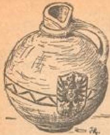
Zeichnung: 1892 Prächtiger Neckargemünder Delfkrug

Der traditionelle Katharinenmarkt in alten Neckargemünd mit seinem buntem Betrieb rückt näher. Wenn die Blätter fallen und der neue Wein in den Gläsern duftet, ist seine Zeit gekommen. Die alte romantische Stadt, die früher einmal sogar unmittelbare freie Reichsstadt gewesen ist, wird plötzlich zum Mittelpunkt des Neckarstals und seiner festlichen Bevölkerung.