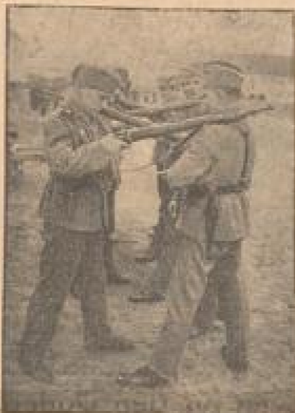
Oben und Mitte: Die ersten Stunden des Gewehrdienstes erfor- dern größte Aufmerk- samkeit Im Kreis: Die Post wird verteilt

Nach der Plein in erhöhe müße Sie fahren, wenn Sie um 11. Bataillon von unserem Infanterie-Be- stand 14 wolle“, erklärt mir eine höhere Schwä- bische, und sie ist stolz darauf, daß sie so genau über die neuen militärischen Verhältnisse ihrer Heimat- stadt Bescheid weiß. An alten und modernen Hän- dern, Badergebäuden, kleinen Wäldern und einem herausragenden schwäbischen Schuppenmann vorüber, kramt unter Wagen. Heber eine kleine Anhöhe