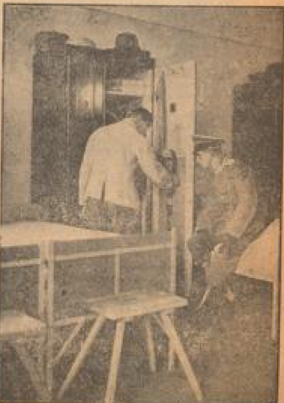
Ordnung muß in jedem Rekrutenstapel herrschen