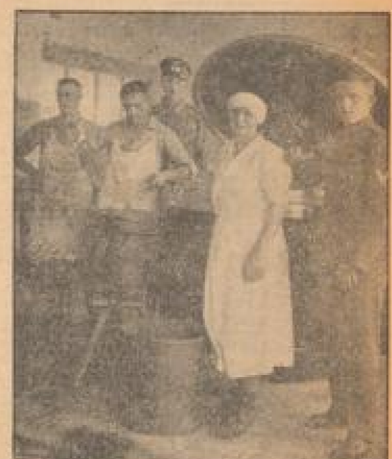
Die Kantine Mutter mit ihrem Stab ...