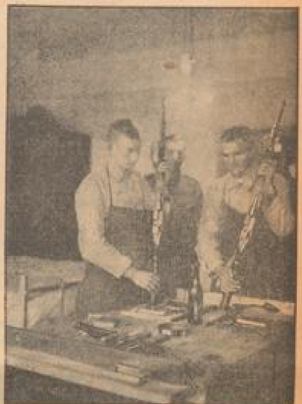
Gewehrputzen — für Rekruten keine einfache Sache

Drei Wochen sind nun bereits die jungen Män- ner vom Jahrgang 14 aktive Angehörige des Hee- res. Aber sind sie noch Rekruten und keine voll- wertigen Soldaten, aber schon hat sie ihre Lebens-