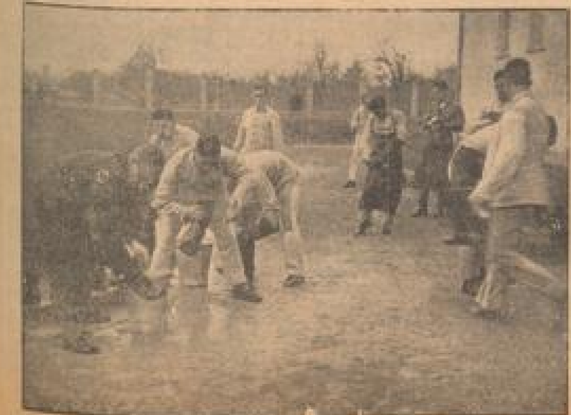
Putzstände — auch ein wichtiges Kapitel