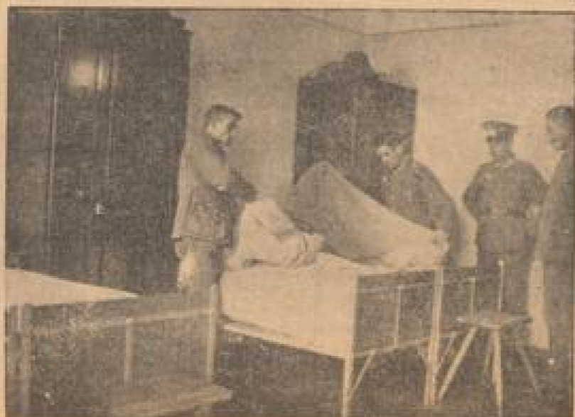
Das Bettenbauen will gelernt sein!