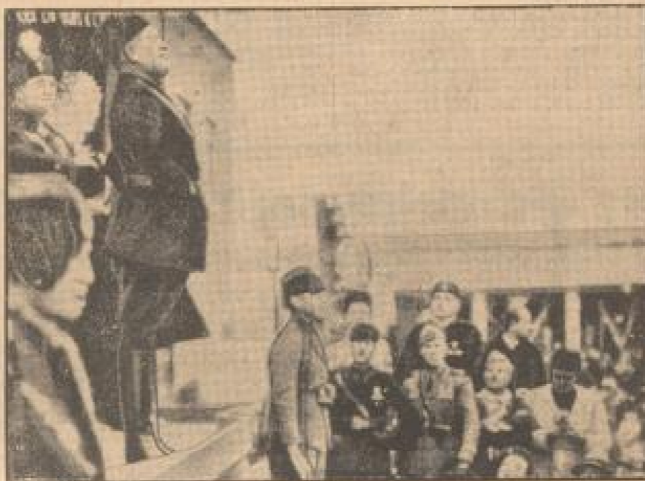
Die Weihe der neuerrichteten Kirche im trockenverfallenen Gebiet der Pontinischen Sümpfe wurde Pontinia von italienischen Regierungsführern geleitet. Unter Beteiligung zahlreicher Priester wurde die Weihe von Pontinia bei Pontinia, deren Gebiet 1934 mit dem Reichsgebiet übergeben wurde. (Weiß, 20)