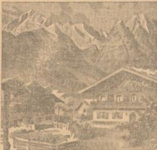
Motiv aus Garmisch-Partenkirchen

Manche Besucher hat der Sommer in Garmisch-Partenkirchen so gefesselt, daß ein Sommer ihnen nicht genügte — sie ließen sich hier nieder, bauten hier sich ein Sommerheim.