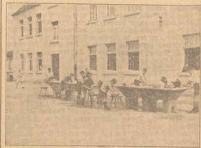
Mannheimer Kinder auf dem Heuberg

Was manchen Eltern bangte Sorge bereiten mag, wenn sie ihr Kind für vier Wochen aus der Hand geben, ist die Frage: