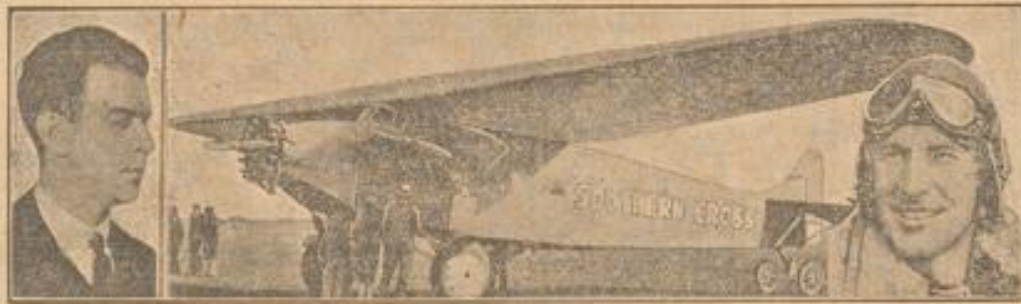
Pilot Charles Elm. Das Flugzeug „Southern Cross“. Pilot Kingsford Smith.

Nach längerem Flug sind die Piloten Elm und Kingsford Smith mit ihrem berühmten Flugzeug „Southern Cross“ in London eingetroffen.