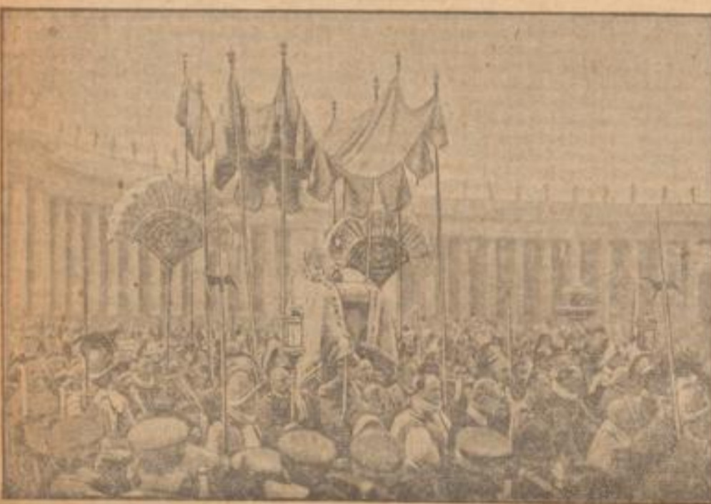
Eine ungeheure Menschenmenge begleitete die großartige Prozession, mit der Papp VIII. den Mann der weltwärtigen Belangen im Vatikan drach und als erster Papp nach 30 Jahren den Boden des Königtums Italiens betrat. Die Schweizergarde in ihren allen Uniformen hielt die Wache, während Papp VIII. in einer Kutsche getragen, das Volk segnete.