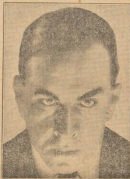
Erich Maria Remarque.

Seiner Erzählungen „Im Westen nichts Neues“ allein in Deutschland bereits eine Million von fast 700.000 Exemplaren verkauft, hat sich nun mit dem amerikanischen „Im Westen nichts Neues“ einen weiteren großen Erfolg gesichert. Das Buch ist nun in einer amerikanischen Ausgabe erschienen.