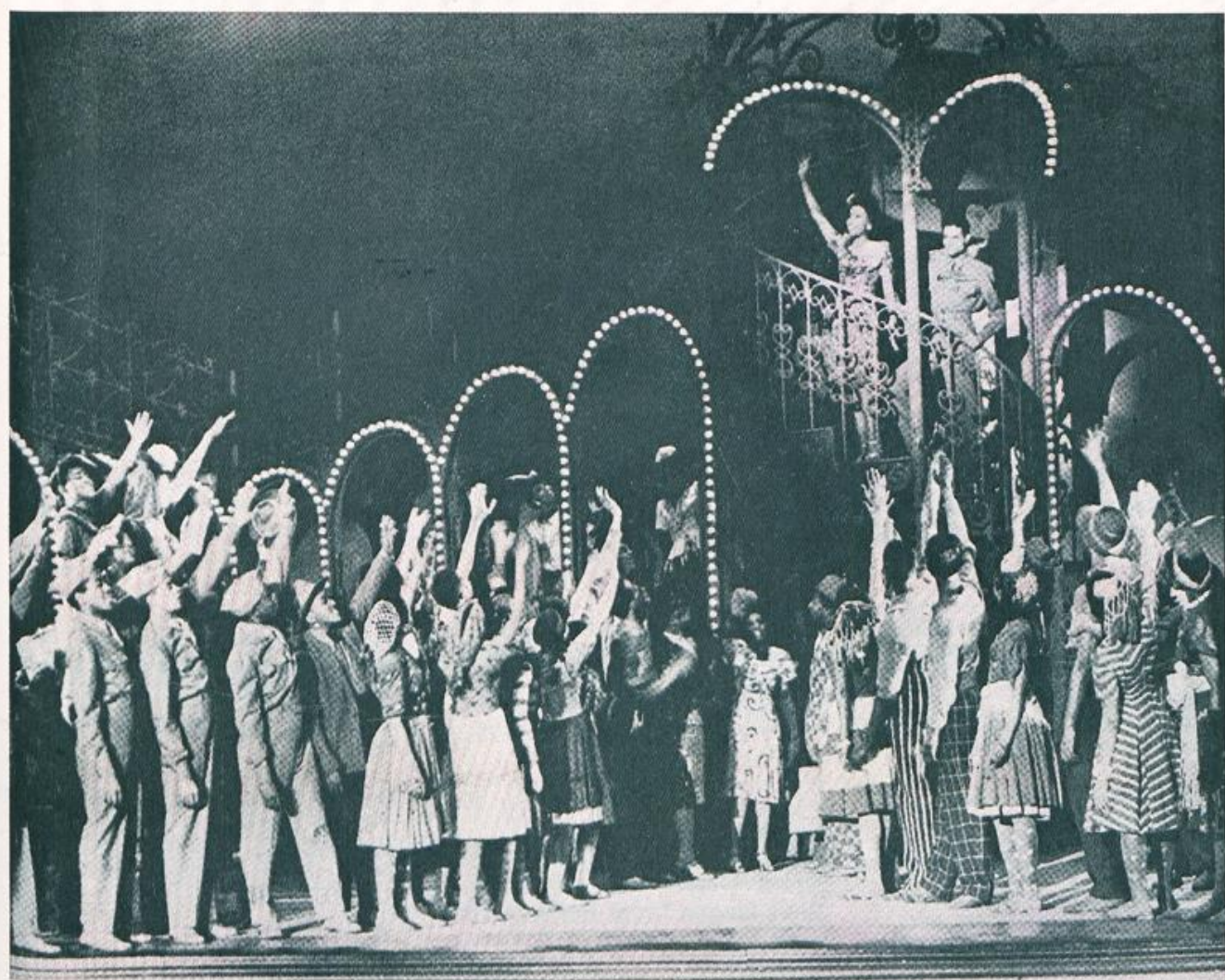
Szene aus «Carmen Jones» in der Broadway-Inszenierung