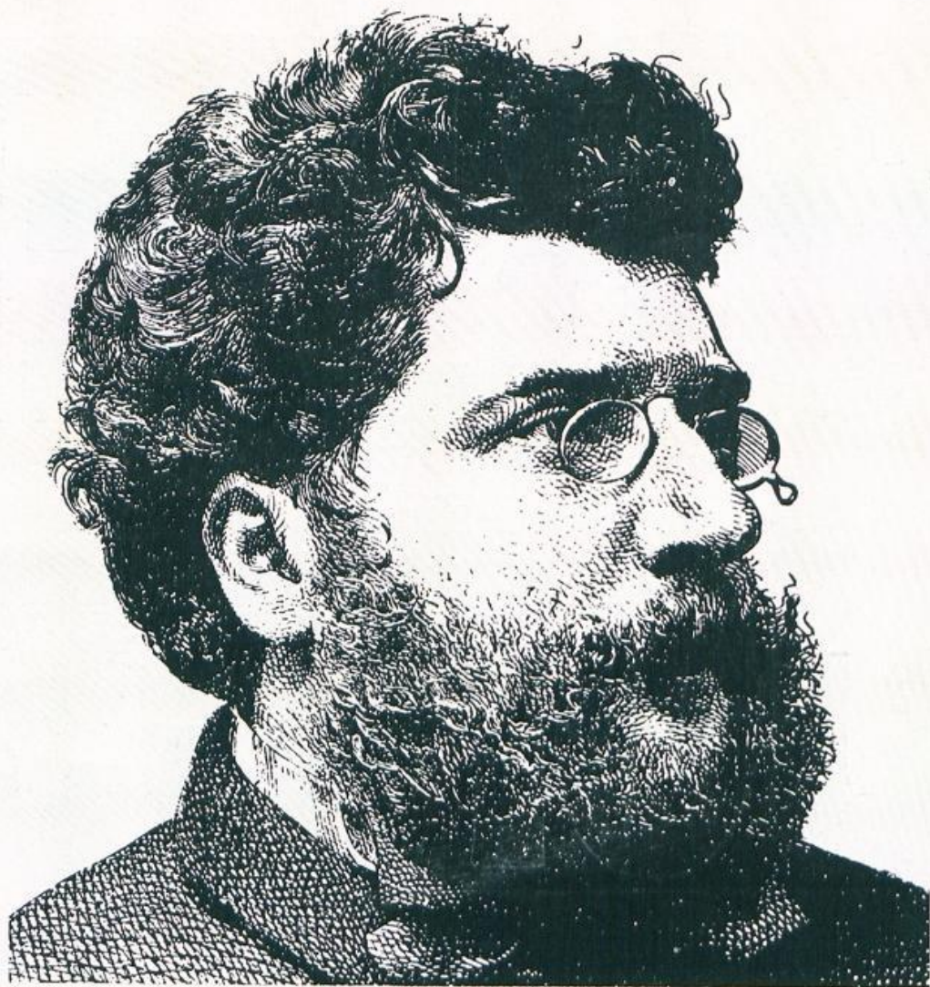
GEORGES BIZET Komponist der Oper «Carmen»