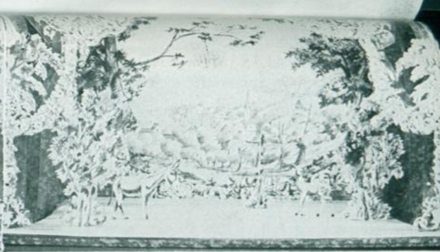
Bühnenbildmodell von Paul Walter