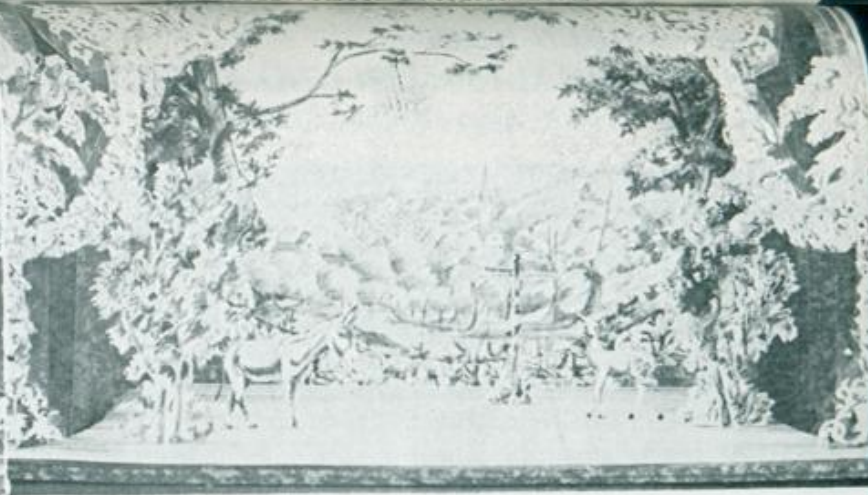
Bühnenbildmodell von Paul Walter