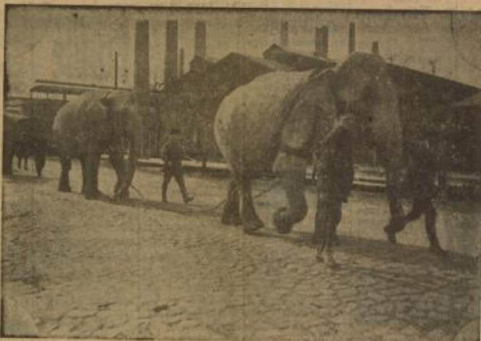
(Der erste Elefant fährt an Ketten hinterher, während hinter ihrem Rücken ein weiterer Dampfer jede ihrer Bewegungen überwacht.)