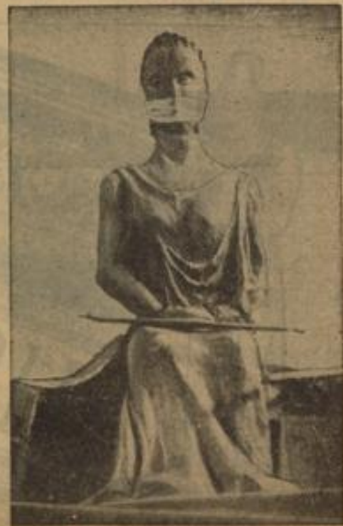
Auf der Pariser Kunstausstellung der Dumortiers fand diese Statue der „Justitia von Bayonne“ mit verbundenem Mund und zerbrochener Waage großen Beifall der Besucher.

Zeit h eigene M sche Pol auf sein zeigte, i wird sein Wir di zeugt sein Geschm gutes Ha stremder machen. Wenn i Wode du Arbeits noch e Die deu im Rahm die deut nunmehr weist es auch ande Vorbild Nebenfl deutsche R Die 2 wegt, sehr Röde in erscheint d Die We schreit der schwinger Die F sings wir Meider A sches Grün Daneben blumig mit Hell züge trägt und braun Die 5 Ueberrash die Silho Man hat schlagen Kinderhul zogenen A sigenheim die mit fü gleichlich Kopfbede innern. 72801 mach gerim 72801 Rigur überb glatter 72801 sind