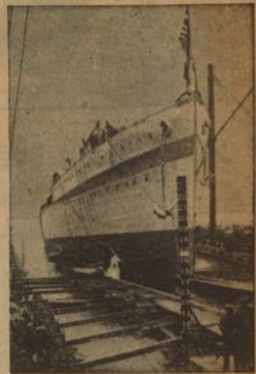
Auf der Chatham-Werft lief der neue 5000-Tonnen-Kreuzer „Arctus“ vom Stapel. Für das diesjährige Flottenbauprogramm hat die englische Regierung einen um nahezu 3 Millionen Pfund höheren Betrag als im Vorjahre bewilligt.

mittag in der Baumwollbörse die Versteigerung eines Baumwollballens statt. Zu dieser Veranstaltung waren außer dem Bürgermeister Dr. Marxert die führenden Persönlichkeiten aus Bremen's Handels-, Bank- und Geschäftswelt erschienen.