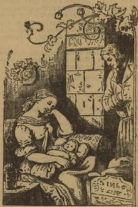
Holzchnitt von Ludwig Richter