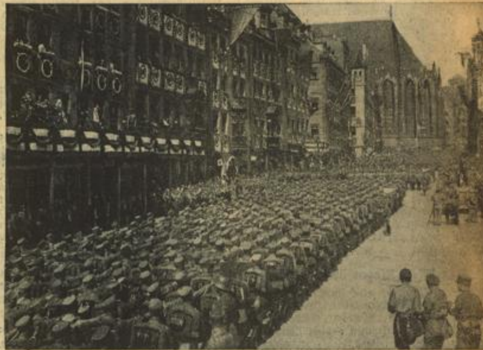
Der Vorbeimarsch vor dem Führer auf dem Adolf-Hitler-Platz in Nürnberg nach dem Appell im Quiltpoldhain. Hunderttausende der SA und SS huldigten dem Führer und Reichskanzler.