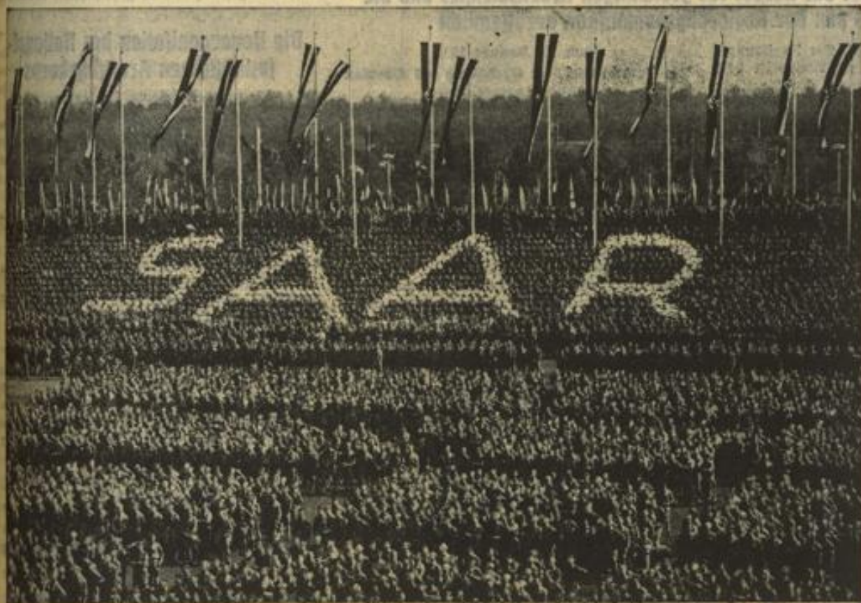
Ein Uebersichtsbild vom Aufmarsch der 60 000 Angehörigen der Hitler-Jugend im Nürnberger Stadion. Die SA aus dem Saargebiet überraschte den Führer mit einer besonderen Ausbunung. Sie hatte sich mit weissem Hemd so aufgestellt, daß sie die Buchstaben SAJA bildete.