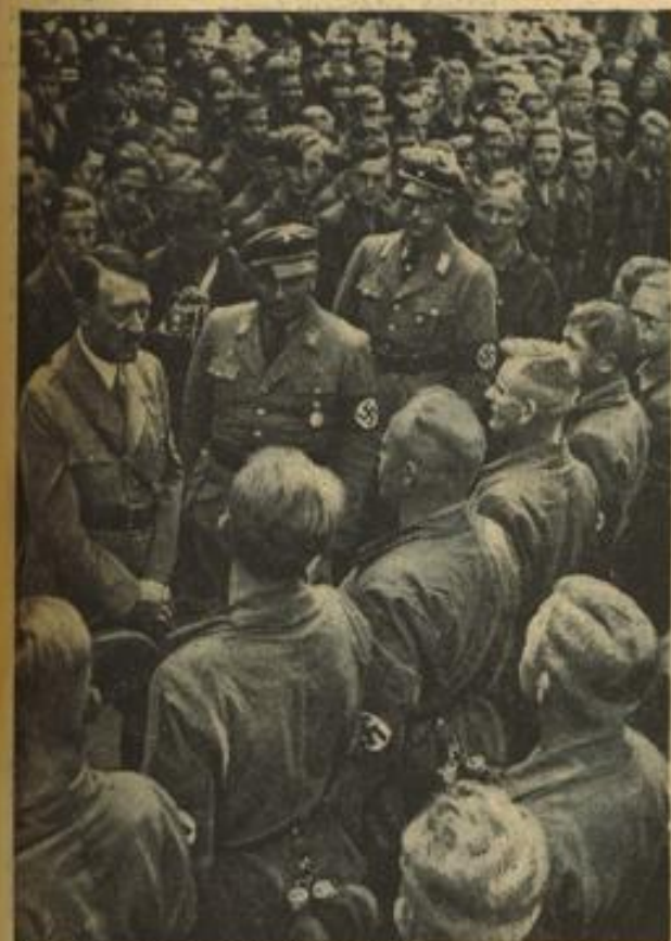
Der Führer unterhält sich mit Jungarbeitern anlässlich des großen Appells der SA auf dem Reichsparteitag.