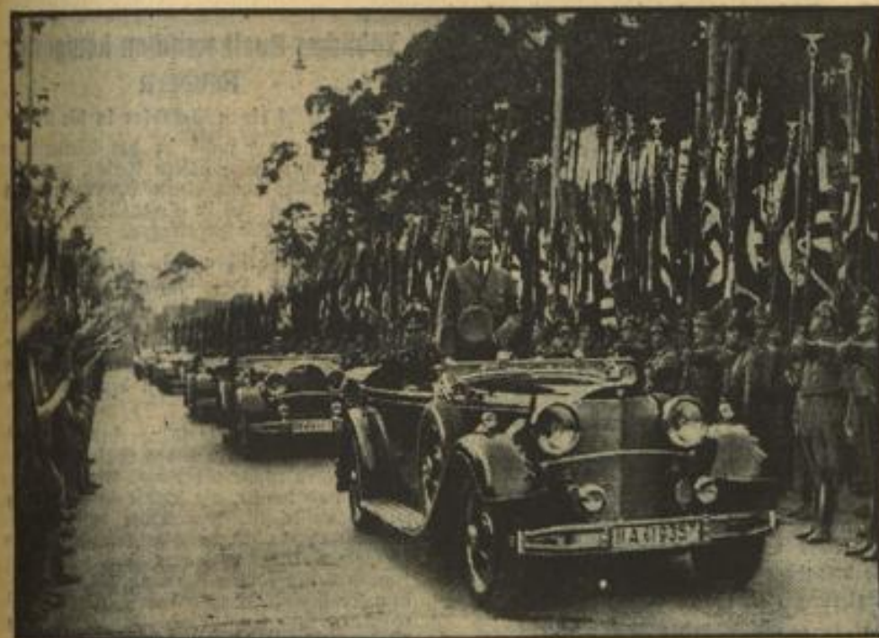
Der Führer fährt durch das Spalier der Fahnen beim Verlassen der Zeppelintwiese, wo 10 000 Politische Leiter mit 21 000 Fahnen zu einem gewaltigen Appell aufmarschierten.