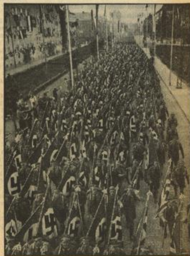
Die Fahnen-Gruppen der Politischen Leiter und der Arbeitsfront auf dem Wege zur Zeppelintwiese in Nürnberg.