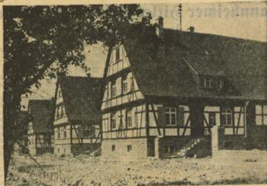
Eine Dorfstraße in alemannischer Bauart