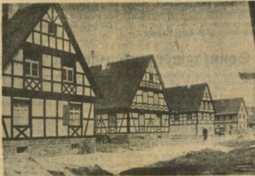
Bauernhöfe in fränkischer Bauart