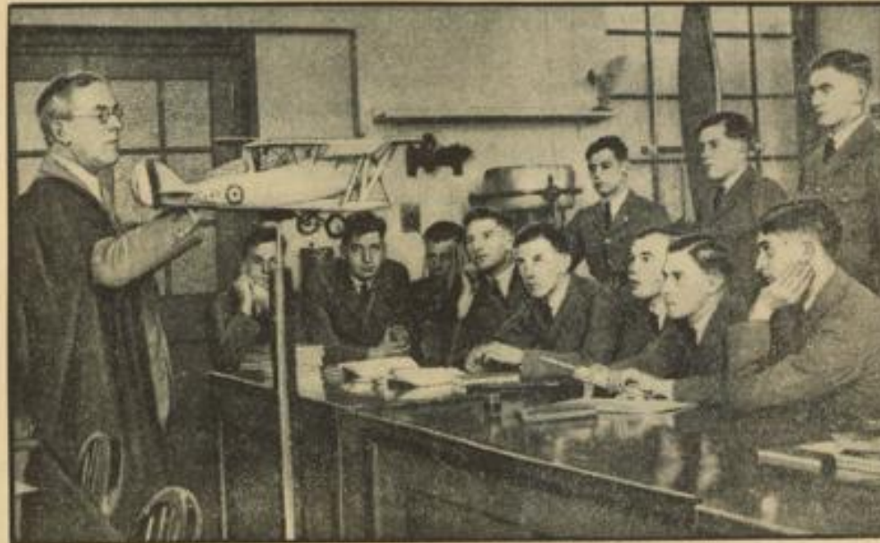
Das soeben vom Prinzen von Wales eröffnete neue Kadetteninstitut der Britischen Luftstreitmacht, wo die jungen Militärflyger die letzte wissenschaftliche Ausbildung erhalten und mit den physikalischen Problemen des Fliegens vertraut gemacht werden.