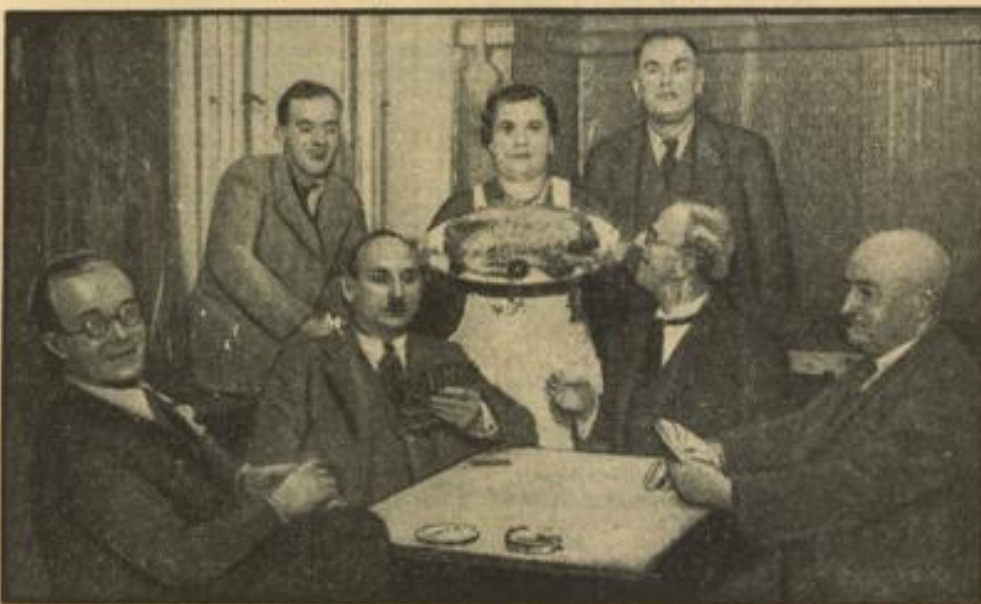
Mit den unfreundlichen Novembertagen beginnt in den Statklub wieder die beliebte Gansschmauserei. Wenn dann die Wirte auch noch mit dem gebratenen Martinsvögel an den Tisch herantritt, dann weiß jeder, wofür er sich anstrengt und welcher Preis ihm für seine Grands und Kull oweris winkt.