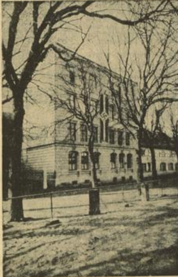
Die Gebietsführerschule der Hitlerjugend in Ettlingen

„Hitlerjugend ist Deutschlands Zukunft!“ Ihre wichtigste Aufgabe besteht darin, alle Ständedünkel zu überbrücken, ihr oberster Grundsatz