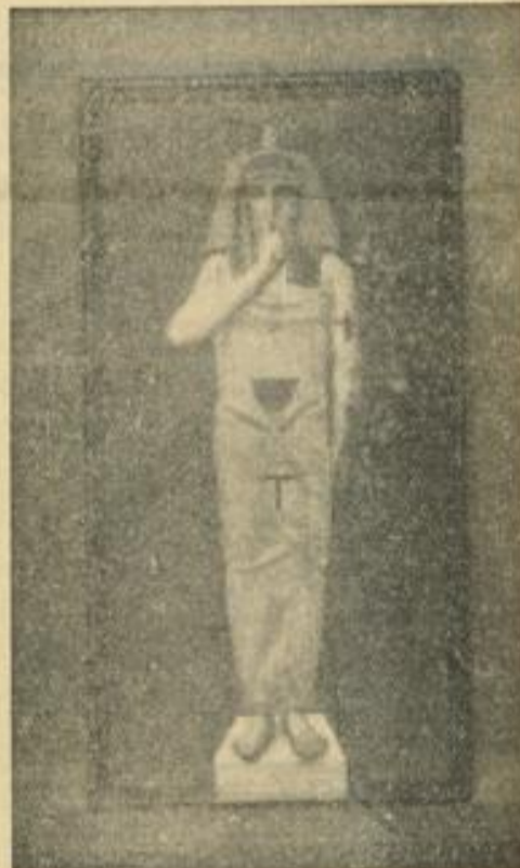
Das symbolisierte Schweigen

Diese Freimaurerfigur ist in fast jedem Tempel zu finden. Die Verblindung ist die Verschlossenheit der Gebräuche, Wege und Ziele der Weltmurererei.