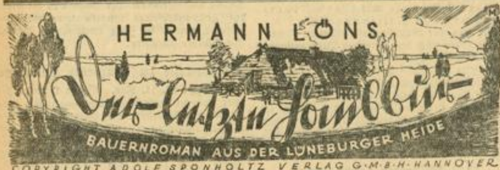
HERMANN LÖNS Der Lüneburger Heide BAUERNROMAN AUS DER LÜNEBURGER HEIDE

18. Fortsetzung So sah er den Himmel für eine Bahgelige und Trina für einen Engel an, und als er sich vor Tau und Tag aus ihrer Kammer stahl und nach dem Hestendose ging, war ihm, als habe er das große Los gewonnen. Er war nun öfter bei ihr, bis daß Klas ihm eines abends, als die Köpfe alle heiß waren von Bier und Grog, fragte: „Wannmehr wollt ihr denn freien?“