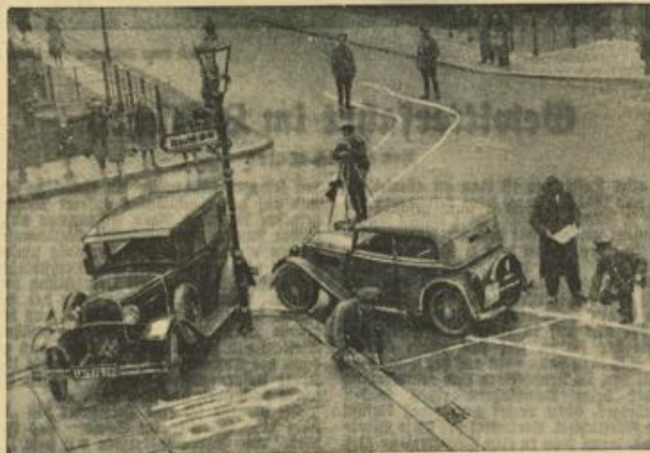
Zur Bekämpfung der Verkehrsunfälle hat der Polizeipräsident von Berlin drei Unfallkommandos der Schutzpolizei eingerichtet, die in kürzester Zeit an Ort und Stelle erscheinen und den Vorgang des Unfalls zu Protokoll bringen, bevor der Großstadtverkehr die Spuren wieder verwischen kann.