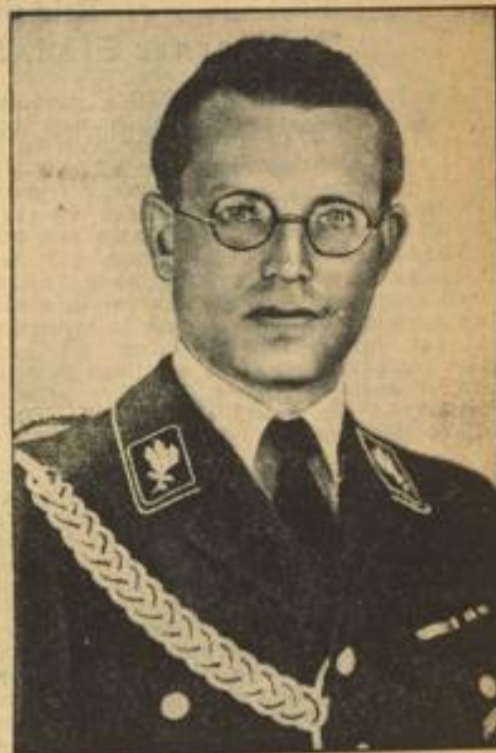
Neueste Aufnahme von Reichsleiter Philipp Bouhler, der zum Chef der Kanzlei des Führers der NSDAP ernannt wurde. Der Führer und Reichskanzler hat zur Bearbeitung aller Parteiangelegenheiten, die an ihn als Führer der NSDAP zur Erledigung gelangen, die „Kanzlei des Führers der NSDAP“ mit dem Sitz in Berlin errichtet

des antarctischen Festlandes vorgelagert sind. Admiral Byrd nennt seinen Flug den wichtigsten, den er jemals unternommen hat.