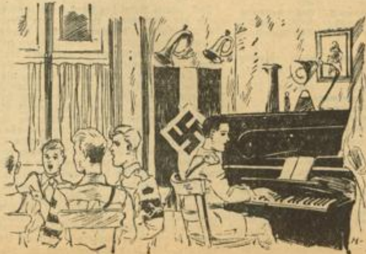
Unten: Ein Lied auf jungen Reden wird gesungen (Heim in D 3 Nr. 2).