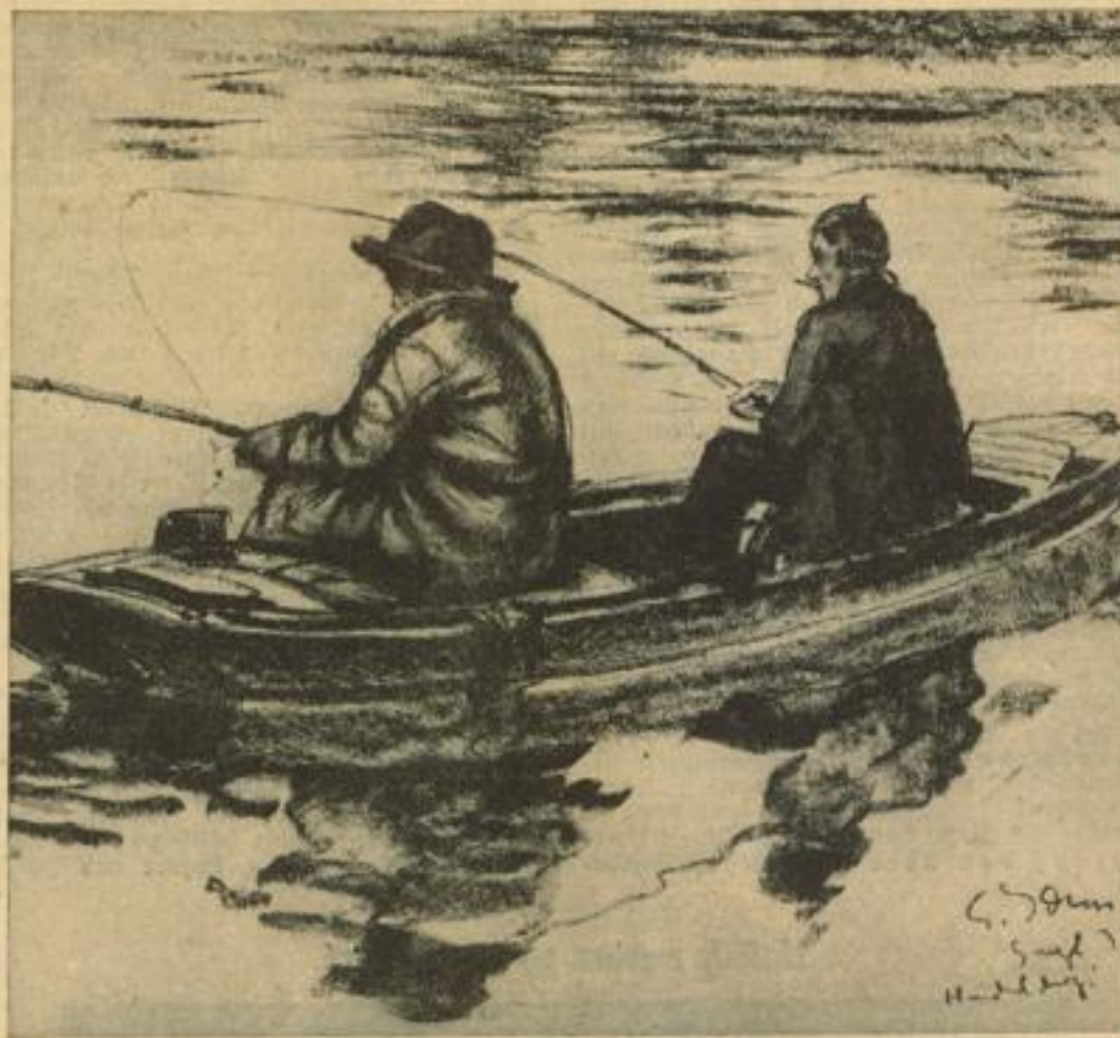
Nach einer Zeichnung von Edgar John