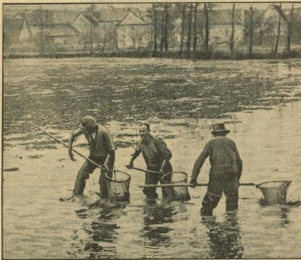
Auch in der Teichwirtschaft ist die Zeit der Ernte gekommen: die Karpfenweiber werden abgefisht. Bis über die Arme stehen die Karpfensicher im Morast des abgelassenen Teiches und fangen die Karpfen mit Handnetzen an Stangen. Unser Bild zeigt drei Karpfensicher beim Einfangen der „Altschneider Spiegelkarpfen“ in einem Weiber am Rande des Altschneiders in Oberfranken