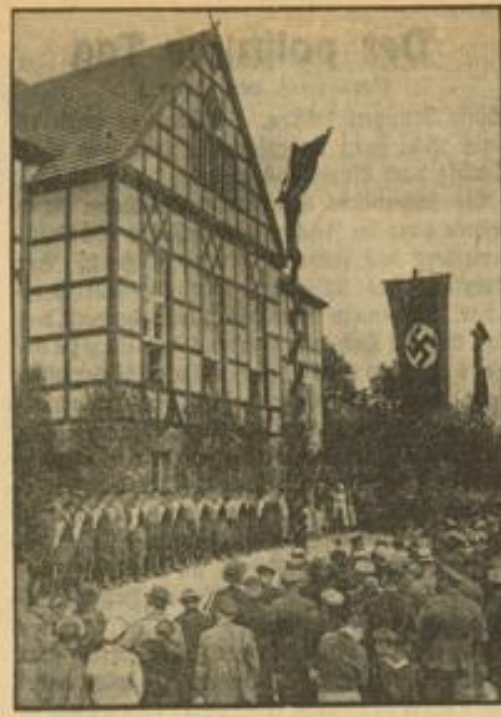
Einweihung der karmeliterischen Bauernschule in Krakau