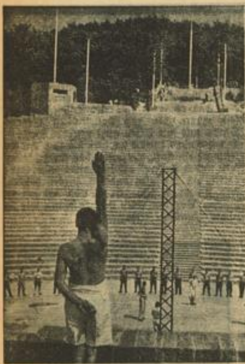
Kuss der Probe des Thingspiels Heimatbilderdienst

Die Heidelberger Reichsfestspiele / Repräsentative Veranstaltung des neuen deutschen Kulturwillens