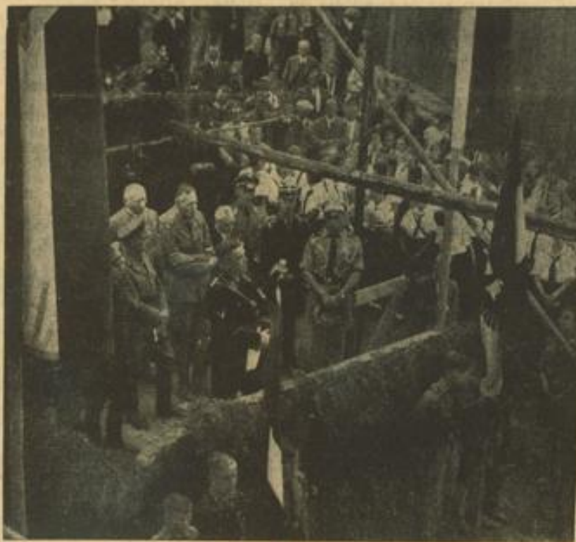
Grundsteinlegung der neuen Schwarzwaldb-Jugendherberge