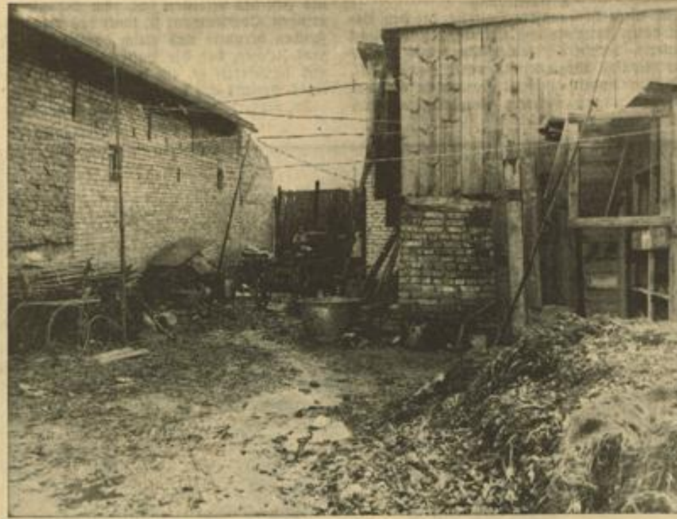
Ein Bild grenzenloser Verwahrlosung...

anderes als Elendsquartiere sind. Leider wissen aber nicht alle Barackenbewohner das Entgegenkommen der nationalsozialistischen Stadtverwaltung zu schätzen, die ihnen neue und gesunde Wohnungen anbietet. Wenn eine frühere Stadtverwaltung auf den Gedanken gekommen wäre, die Elendsquartiere aufzulösen — auf einen solchen Gedanken kam man damals aber nicht — dann hätte man bestimmt die Leute kurzerhand auf die Straße gesetzt und es ihnen überlassen, wo sie eine Unterkunft finden.