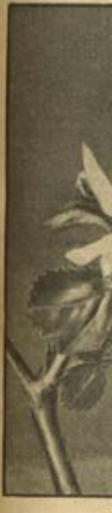
in im Hause der Nunmehr hat den die Wädh unterstützt mit una wuch durch Blütenblätter

Kommunif San Fra Kofa (Kalifor mäßigte Vol nerstag ein g gen Komm versucht hatten ruhe zu stiften mit Kraftwagen zwei Kom federt und Einer der (p durch Tränen ausgetrieben, Zeitlang durch Widerstand gel munisten muß von etwa 50 K ter der Bewölk und wurden lanische F Die Moskau, 2 lich meldet, h beschlossen bis der Revolution Loren noch üb nen und an i kern mit S bringen. E Historischen M werden.