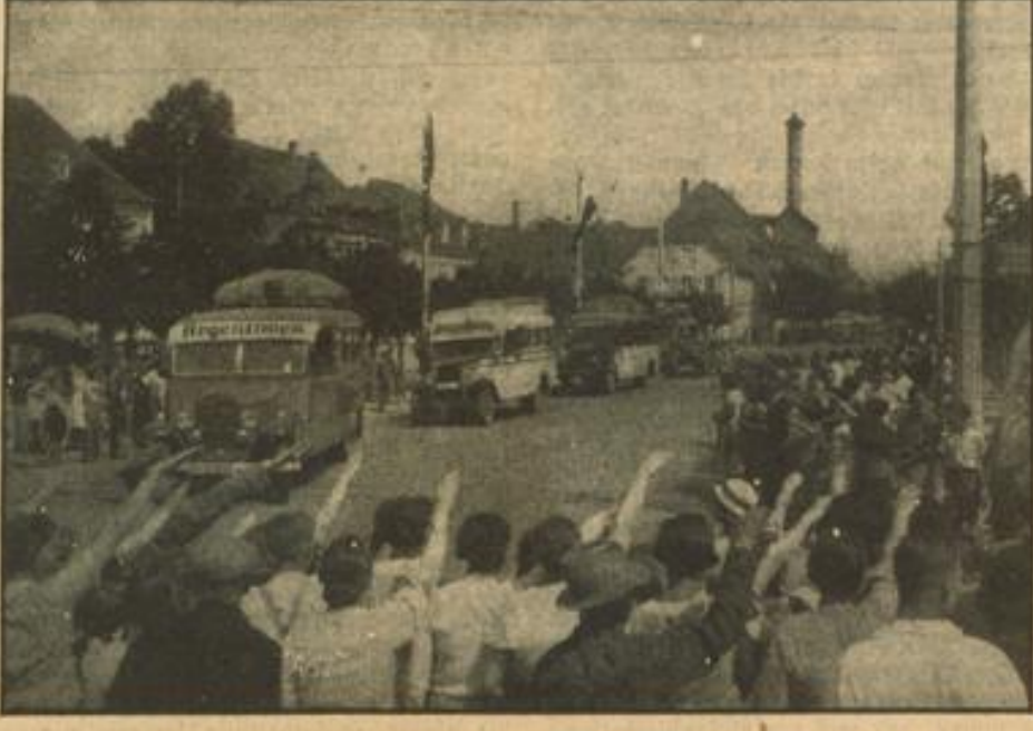
Auslandsdeutsche Jugend in Schwesingen begeistert begrüßt

Wir freuen uns, daß die auslandsdeutschen Kameraden einen so tiefen Eindruck von Baden erhalten haben.