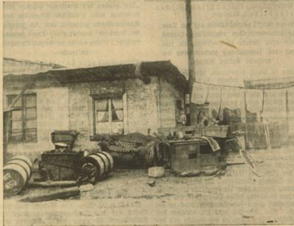
Die Wohnstätte eines „Spelzengärtner“ vor dem Abriss

zweifeltsten Volksgenossen in die Hände und bereitet ihnen nunmehr