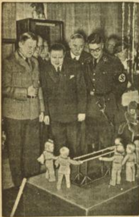
Soaneberger Spielzeug und Lauschaer Christbaumschmuck in der neuen Thüringen-Schau