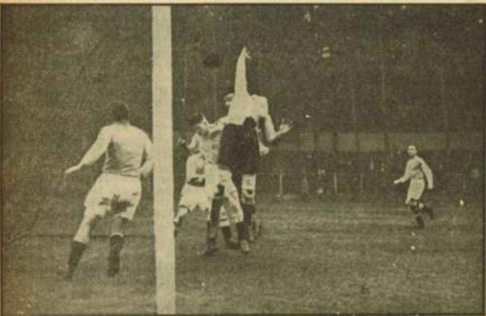
Aut.: Franck Viernheim — VfB Mühlburg 3:1 HB-Bildstock Becker im Mühlburger Tor muß sich gewaltig strecken, um die feine Linkshand vor dem hochspringenden Koob anschnädelich zu machen.

Nach vierstündigem Spiel verwandelte Seher einen Handball zum 1:0, dann alch Schoser mit Kopfball aus. Seher und Rothmann stellten das Pausergebnis her. Peters war der nächste Torhüter, dann kam Karlsruhe durch Viehle zu einem zweiten Gegentreffer. Im Anschluß an einen Schiedsrichterball stellte Seher das Endergebnis her. — 1200 Zuschauer; Schiedsrichter Coronini (Konstanz).