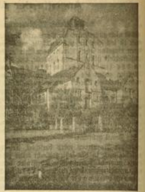
Die Städtische Festhalle in Landau