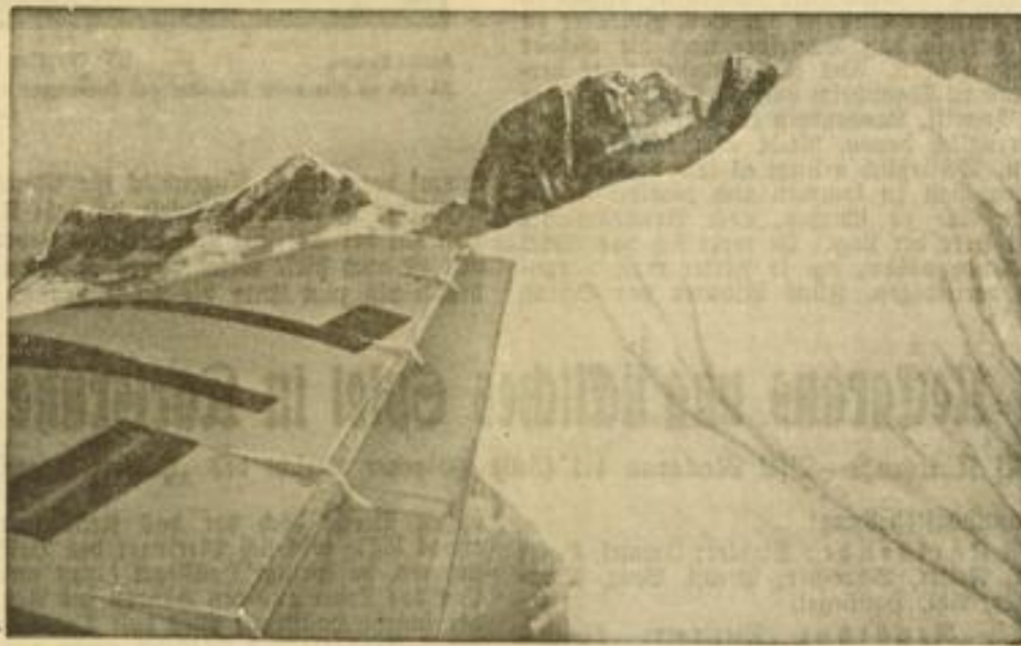
Mit dem olympischen Flugzeug über Zeuss Thron Die Junkersmaschine, die sich auf einem Werbetafel für die Olympischen Spiele Berlin 1936 befindet, überfliegt das schneebedeckte Gipfel des Olymp.

Blau-schwarzen alles hergeben werden, um ehrenvoll abzuschneiden. Da ist es wohl oder übel erforderlich, daß man mit etwas mehr Strategie an eine Aufgabe herantritt.