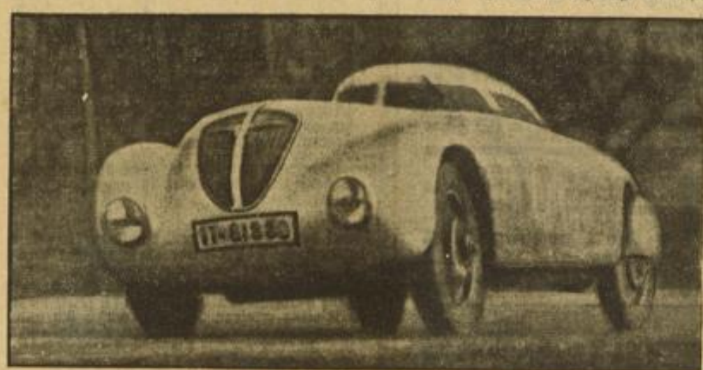
Neuer Erfolg der deutschen Automobilindustrie. Der Adler-Sportwagen während seiner Rekordfahrt auf der Avus. Er erreichte über 4000 Kilometer einen Durchschnitt von 125,8 Kilometer in der Stunde und verbesserte den für Sportwagen bestehenden Langstreckenrekord um 25 Prozent, eine Leistung von internationaler Bedeutung.