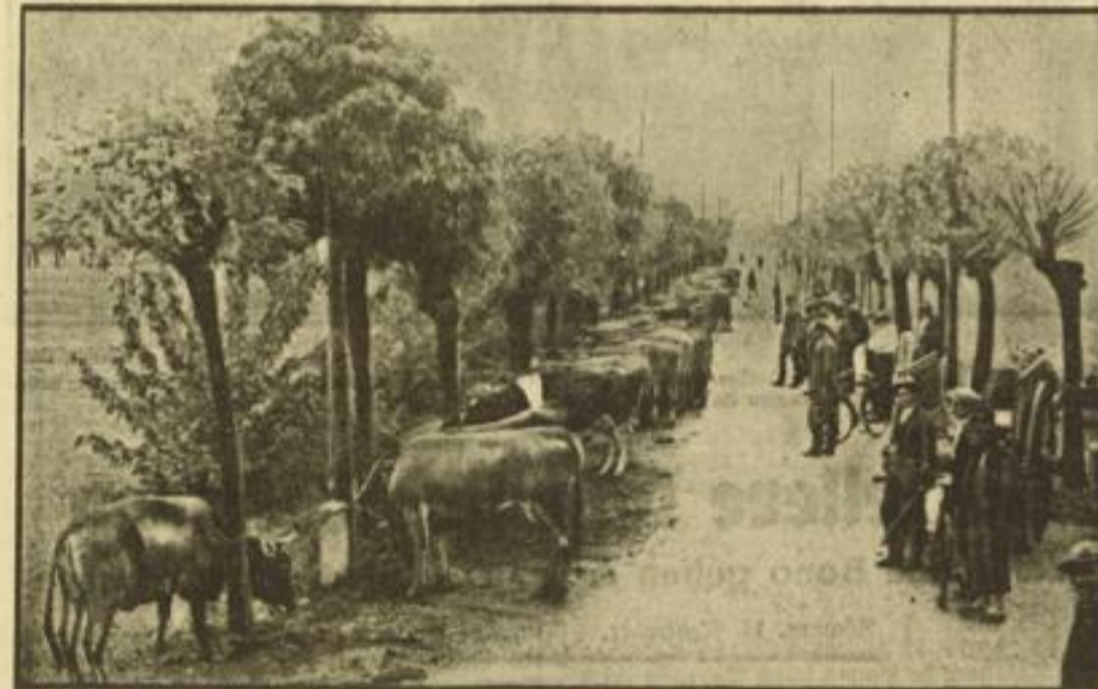
Die Bauern in der Umgegend von Gorgonzola in Oberitalien haben ihr Vieh auf die höher gelegenen Straßen bringen müssen, weil weite Flächen durch Hochwasser völlig überschwemmt wurden.

Der Beamte kann in unserem heutigen Staate kein Sonderdasein mehr führen; er ist