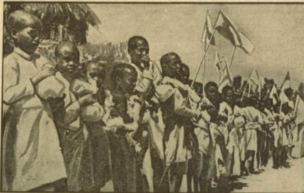
Wie sich Makalle ergab Abessinische Jungen mit weißen Fähnchen und kleinen Beuteln Lebensmitteln zeigen den in Makalle einrückenden italienischen Truppen die Bereitschaft der Bevölkerung, sich zu unterwerfen.

Marschall Badoglio wurde beauftragt, de Bono als Oberkommissar für Ostafrika abzu- lösen.“