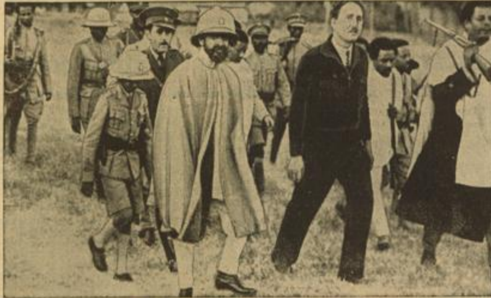
Erstes Bild nach dem Bombardement von Dessau. Unsere Aufnahme aus dem kaiserlichen Hauptquartier in Dessau...