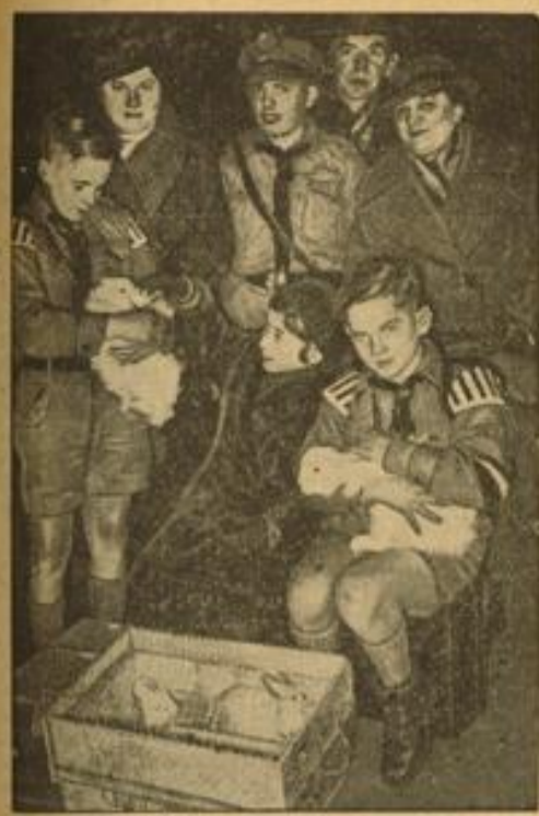
Heimkehr aus dem Landjahrausenthalt. Zahlreiche Jungen und Mädchen kehrten am Wochenende aus dem Landjahrausenthalt zurück und wurden bei der Ankunft stürmisch von ihren Angehörigen begrüßt. Einige brachten sogar einen Weihnachtsbraten mit. Weibbild (10)