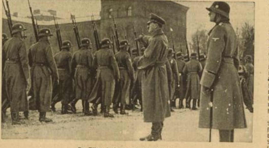
Der Führer besichtigt seine Leibstandarte Am Dienstag, 17. Dezember, besichtigte der Führer in der Kaserne Berlin-Lichterfelde seine Leibstandarte. Im Anschluß an die Besichtigung nahm der Führer den Vorbeimarsch ab. Hinter dem Führer steht auf unserem Bild der Kommandeur der Leibstandarte, SS-Obergruppenführer „Sepp“ Dietrich.

Schon lange vorher hatte sich vor den breiten Rampen des Nationaldenkmals eine gewaltige Menschenmenge, hauptsächlich Frauen, aber auch viele Witwen und Jugendliche, die die Traurige verorbener Familienmitglieder zum Opfer brachten, versammelt. Nachdem ein Priester Tausende von Stabtringen, die gegen die goldenen Traurige eingetauscht werden, eingegsegnet hatte, stieg als erste italienische Frau langlamen Schrittes die Königin von Italien, begleitet von einem Zug römischer Kriegertwinnen und hoher Parteipersonlichkeiten, unter dem Gehang vaterländischer Lieder die Stufen des Nationaldenkmals hinauf, um am Grabe des unbekanntem Soldaten die Traurige des