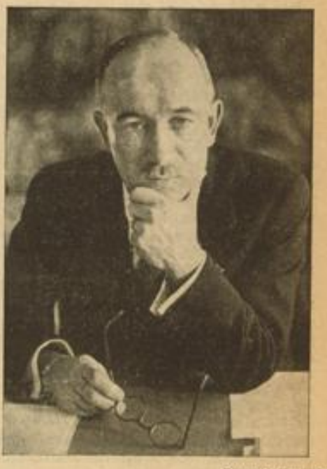
Benesch, der neue tschechische Staatspräsident

Starke Mehrheit im 1. Wahlgang / 440 Stimmen, 21 Salutschüsse