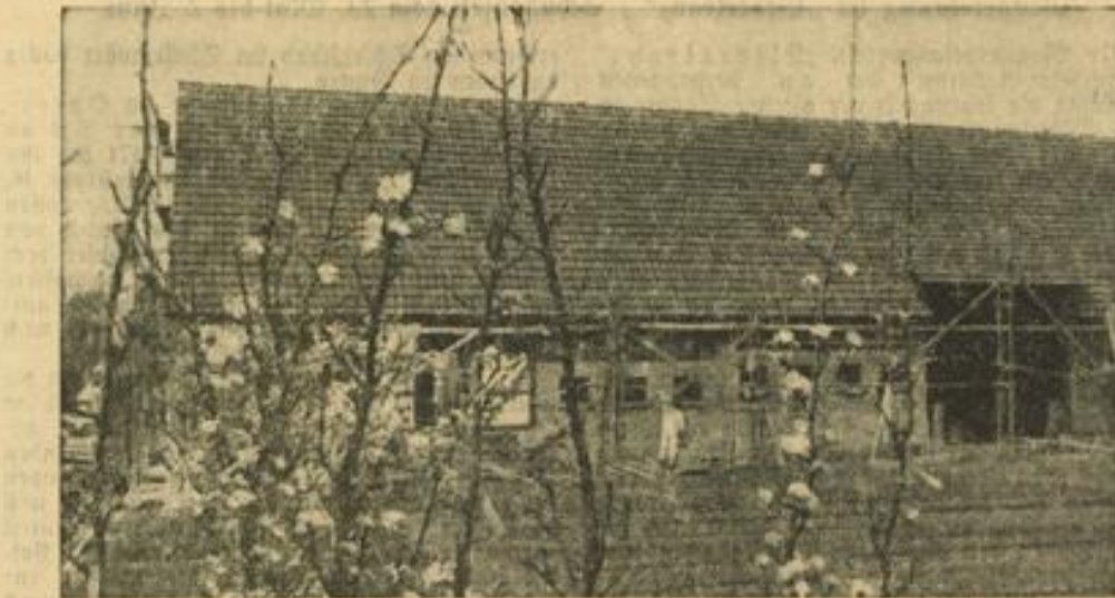
Ein Blick durch die Blütenzweige auf den fast vollendeten Bauernhof

Dann stehen wir am Erbe der ersten Hälfte des Geländes der Reichsnährlands-Schau. Das vorhandene Messengelände an der Festhalle war ja für die Riesenausmaße der Reichsnährlands-Ausstellung zu klein, und die Stadt Frankfurt stellte noch ein weiteres Gelände jenseits der Esmer Straße zur Verfügung. Fast 400 000 Quadratmeter umfaßt das Gelände der 3. Reichsnährlands-Schau, das rund 120 000 Quadratmeter mehr als im Vorjahre in Hamburg. Zwischen beiden Teilen des Ausstellungsgeländes wird eine abgeschlossene, sieben Meter breite Straße, die unter der Brücke der Bahnstrecke Frankfurt-Wiesbaden durchführt, die Verbindung herstellen.