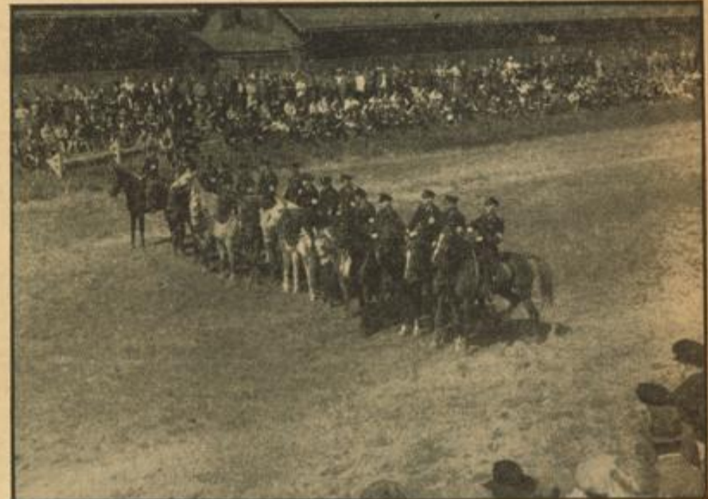
Die SS-Reiter vor dem Start