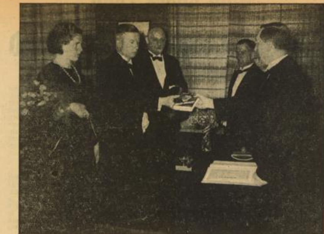
Jedes Brautpaar erhält „Mein Kampf“ Laut Verfügung des Reichs- und Preussischen Ministers des Innern wird ab 1. Mai jedem Brautpaar bei der Eheschließung ein Exemplar des Buches des Führers „Mein Kampf“ durch den Standesbeamten überreicht.

Nach unter dem Eindruck all der vielen Sehenswürdigkeiten ging es dann in flotter Fahrt nach Mainz, und von dort auf der linken Rheinseite nach dem bekannten Weinort Riebsheim, wo bei einem Dämmerchoppen der herr-