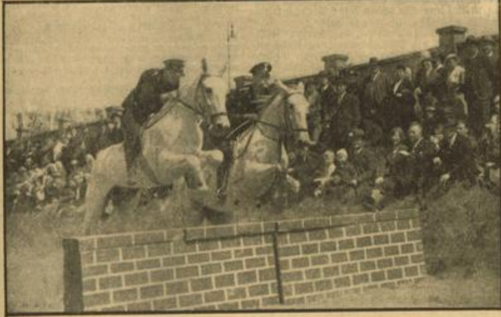
Ein Hindernis wird genommen

Alles in allem: Der Maimarkt 1936 war ein großer Erfolg! (Prämierungsliste siehe nächste Seite!)