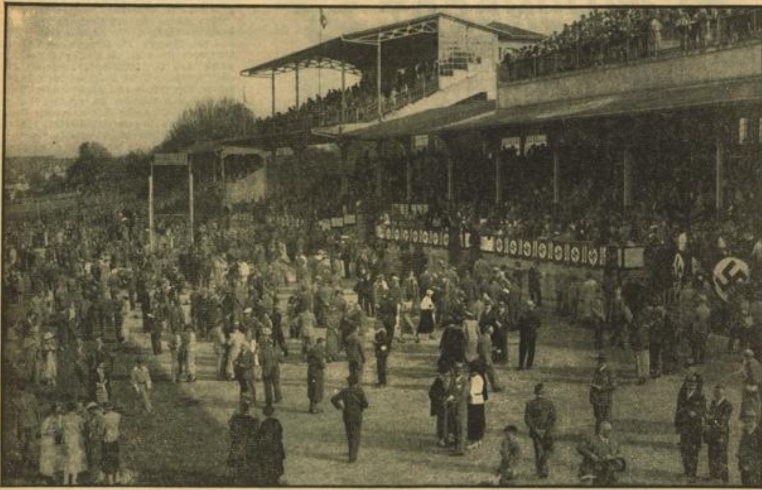
Sattel- und Tribünenplatz während der gutbesuchten Mannheimer Rennen am Maimarkt-Dienstag