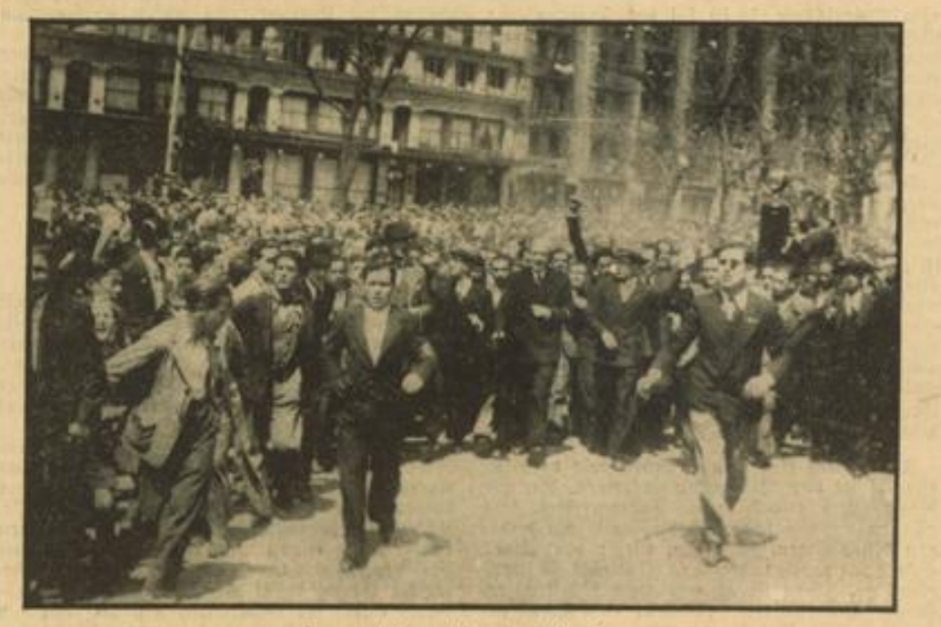
Immer wieder — Unruhen in Spanien Immer wieder kommt es in Spanien zu neuen kommunistischen Unruhen. Unsere Aufnahme wurde am 1. Mai während einer Kommunisten-Demonstration hergestellt.

„Während der 30 Jahrhunderte seiner Geschichte“, so führt er weiter aus, „hat Italien viele denkwürdige Stunden erlebt. Aber die heutige ist eine der feierlichsten. Ich kündige dem italienischen Volk und der Welt an: Der Krieg ist beendet. Ich kündige dem italienischen Volk und der Welt an: Der Friede ist wieder hergestellt. Nicht ohne innere Ergriffenheit und nicht ohne Stolz spreche ich nach sieben Monaten harten Kampfes dieses große Wort aus. Allein es ist dringend notwendig hinzuzufügen, daß es sich um unseren Frieden, um den römischen Frieden handelt, der in folgender einfachen, unwiderruflichen, endgültigen Fassung seinen Ausdruck findet: Abessinien ist italienisch. Italienisch de facto, weil es von unseren siegreichen Heeren besetzt ist; italienisch de jure, weil mit dem römischen Adler die Kultur über die Barbarei triumphiert, die Gerechtigkeit über die grausame Willkür, die Erlösung über die tausendjährige Sklaverei. Mit der Besetzung von Addis Abeba ist der Friede bereits eine vollzogene Tatsache. Die vielfältigen Rassenstämme des Exaiser (Fortsetzung siehe Seite 2)