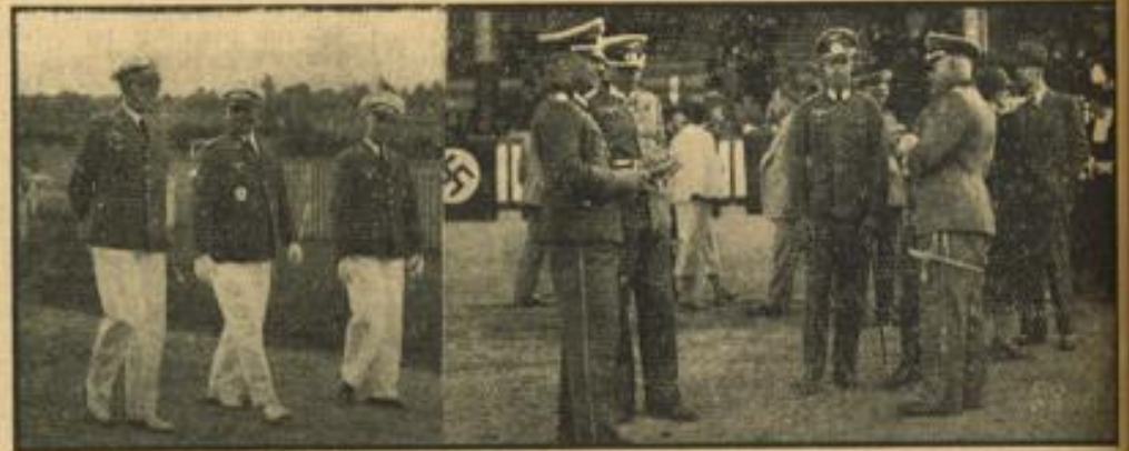
Vom „Badenia-Tag“ der Mannheimer Mai-Rennen. Zum ersten Male waren die Formationen der Wehrmacht stark vertreten.

Nach seinen bisherigen Leistungen zwischen den Flaggen holte sich Treuer Husar erwartungsgemäß den Maimarktpreis. Der Wallach