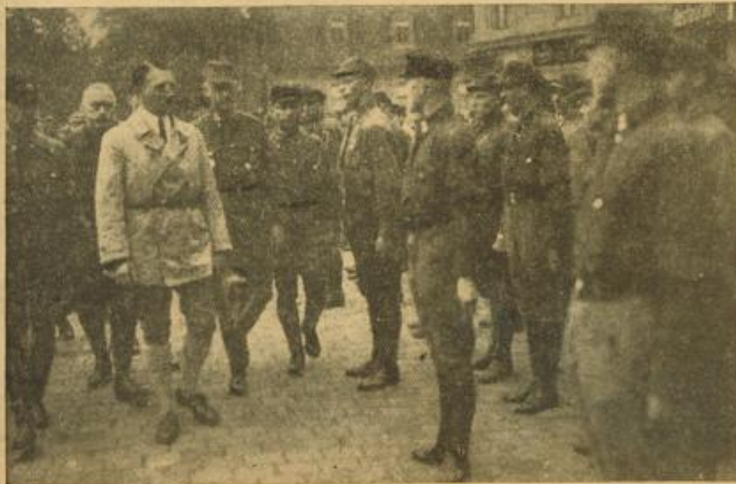
Der Führer begrüßt SA-Männer aus dem Ruhrgebiet