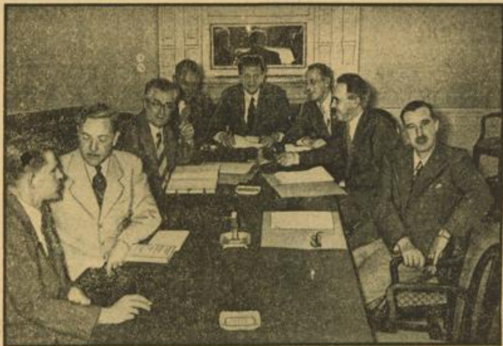
Zum Literatur-Wettbewerb der Olympischen Spiele. Sitzung des Preisgerichts des Literatur-Wettbewerbs im Kassawettbewerb der XI. Olympischen Spiele unter Vorsitz von Staatsrat Hanns Johst im Hotel Kaiserhof in Berlin.

Der Sonntag bringt als Hauptereignis den Senats-Vierter. Neben dem Gewinner des am Samstag entschiedenen Zweiten Vierter hatten Pannonia Budapest, die Jellen Würzburg, Grünau und Mainz, Adner RB von 1877, Wiking Berlin, Berliner RC, um den Silberpokal im Ersten Einer kämpfen.