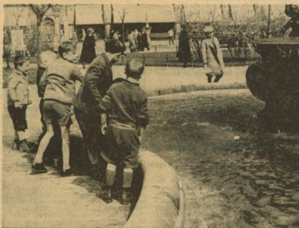
Tragödie am Paradeplatzbrunnen bei der wassersportlichen Betätigung unserer Jugend. Durch Wind und „Wellenschlag“ ist das aus einem Stück unbearbeiteten Holz bestehende Schiffehen eines Jungen weggeschwommen, so daß es nicht mehr erreicht werden kann. Während der „Schiffsbesitzer“ bittere Tränen wegen seines im Verlust geratenen Eigentums vergießt, beraten seine Spielkameraden, ob der „Ausreißer“ nicht doch noch ans „Ufer“ geholt werden kann.

Leider sind nicht alle Menschen darauf bedacht, die Anlagen und was sonst noch dazu gehört, in Ordnung zu halten, so daß es hier und da berechtigten Grund zur Klage gibt. Wenn sich unsere Jugend die Becken der Wassertürme als Spielplatz ausgesucht hat, um