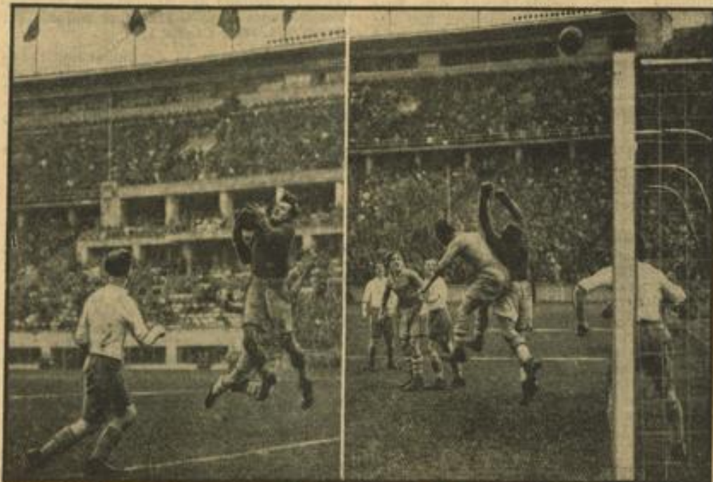
Schalke schlägt Hertha-BSC im Gruppenspiel um die Deutsche Meisterschaft Zwei Kampfmomente vor dem Hertha-Tor im Olympiastadion, wo Westfalens Meister den Meister von Brandenburg 2:1 schlug Weltbild (M)

Auf dem Programm stehen diesmal nicht weniger als 15 Sportarten — Leichtathletik, Schwimmen, Fußball, Handball, Hockey, Rugby, Wasserball, Rudern, Basketball, Turnen, Boxen, Fechten, Tennis, Schießen und Radsport. Für Studentinnen sind fünf Sportarten — Leichtathletik, Schwimmen, Fechten, Tennis und Turnen — vorgesehen. Die Sieger sowohl der Einzel- als auch der Mannschaftswettbewerbe erhalten den Titel „Studenten-Weltmeister“. Die Spiele stehen unter der Schirmherrschaft des Generalkommissars für die Pariser Weltausstellung, der auch die Durchführung finanziell unterstützt, so wird beispielsweise auch ein neues Stadion für 30.000 Zuschauer errichtet.