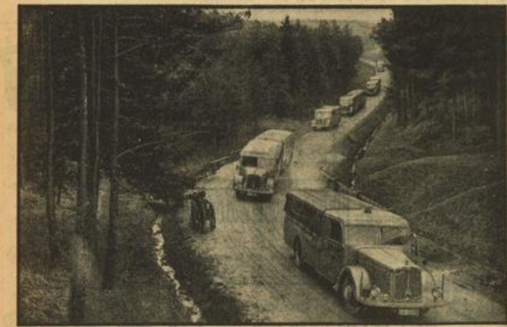
Reichsautozug „Deutschland“ unterwegs im Fichtelgebirge auf der Fahrt nach Berlin, wo jetzt die Vorbereitungen für die Übertragung der Hauptkundgebung des 1. Mai getroffen werden.

tage, wo der Zug nach einstädtiger Fahrt in der Nähe der Luisenpark-Arena parkt, treffen wir ihn, um an seiner Weiterfahrt nach der Reichshauptstadt teilzunehmen. Punkt 7 Uhr geht es los, hinein in den dunstigen Morgen des Apriltages.