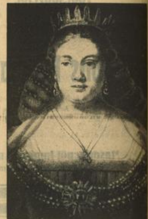
Ein wiedergeborener Rembrandt In New York wird demnächst ein Gemälde von Rembrandt gezeigt, das erst vor kurzem wiederentdeckt wurde. Es stellt die Göttin Juno dar, nach Art einer holländischen Königin des 19. Jahrhunderts gekleidet.

Mozart nickte und wiederholte: „Ja, ihr Herren, Rätselhaftigkeit bleibt...“