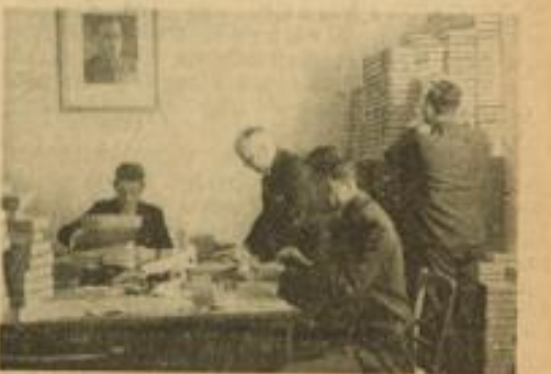
Die Helfer der Ortsgr. Erlenhof packen Feldpostpakete