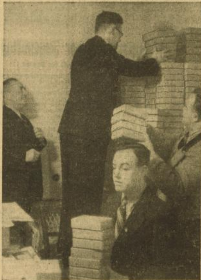
Ganze Stapel Pakete für die Soldaten...

Als der Krieg ausbrach, wurden viele in den Fronten gerufen. Aber alle, deren schärfster Wunsch es ist, mit der Waffe zu kämpfen und zu Hause ihre Pflicht erfüllen müssen, denken an ihre Kameraden draußen an der Front.