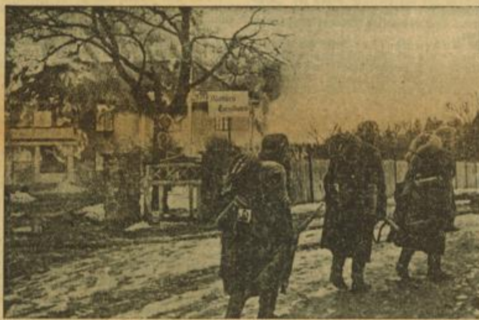
Bildbericht von den Kämpfen in Südnorwegen. Ein eindrucksvolles Bild vom Vormarsch unserer Infanterie, der im südnorwegischen Raum zunaufhaltend nordwärts vor sich geht.

Am 26. April nachmittags wurden auf der Insel Solt im Rantumboden auf der Battermeeresseite die Leiche eines englischen Fliegers und das Fahrgestell eines englischen Flugzeuges angetroffen.