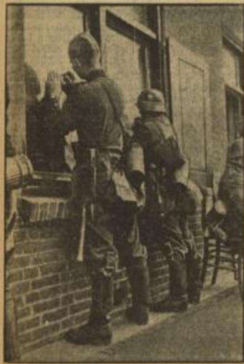
Größe von der Front

Die Sowjetregierung bemerkt, daß die Tatsache selbst, daß die englische Regierung die Erörterung von Fragen vorgenommen hat, die ausschließlich zur Kompetenz der Sowjetregierung gehören, nicht vom Vorhandensein des Wunsches auf Seiten der englischen Regierung zeugt, Handelsbesprechungen mit der Sowjetunion zu führen.