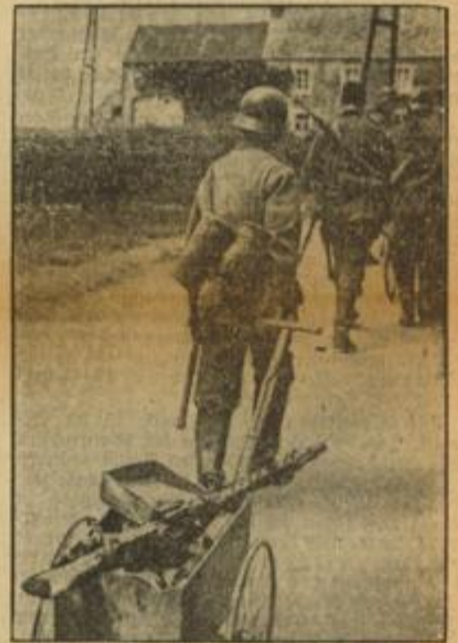
Bei unseren Truppen in Belgien. Alle nur greifbaren Fahrmittel benutzt die Infanterie, um ihre MG- und Munition vorwärtszubringen.