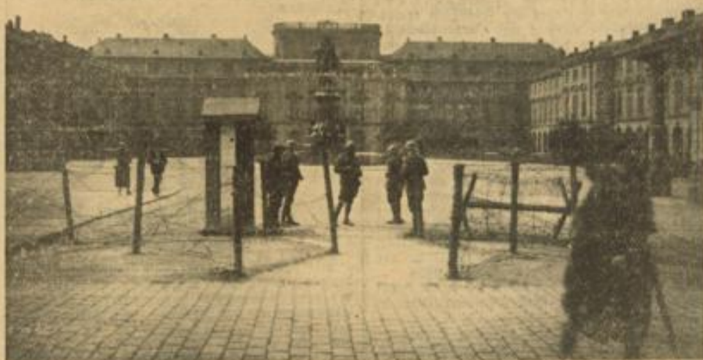
Die französischen Besatzungstruppen errichteten vor dem Eingang zum Mannheimer Schloß Barrikaden

Viel zu rasch haben wir vergessen, daß auch in Mannheim bei der Rheinlandbesetzung schwarze Truppen, die im Solde Frankreichs standen, die Bevölkerung tyrannisierten. Das folgende Gedicht, das uns an diese Zeit erinnert, entnehmen wir dem „Heimatsbuch der Stadt Mannheim“.