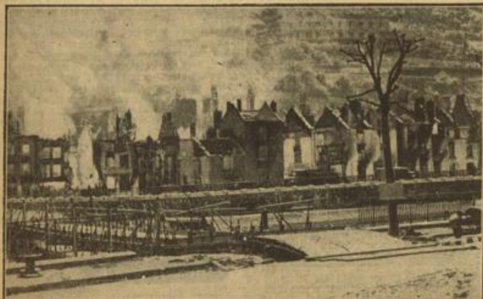
Zerschossene Häuser in Bouillon