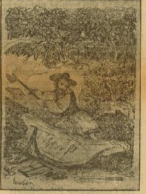
So lebte und arbeitete Robinson Dieser Stich stammt aus einer alten und sehr seltenen Ausgabe des K. Debes „Robinson“ aus dem Jahre 1820.

„Was soll das bedeuten? Wollen Sie mich zum besten haben?“ fuhr der Kranke auf.