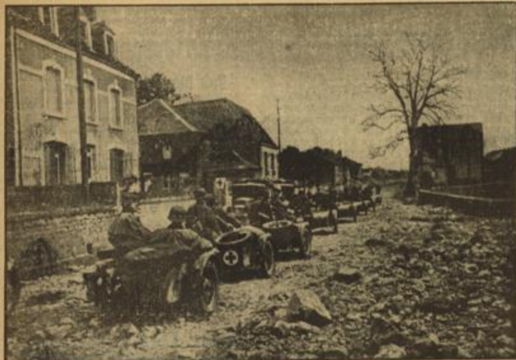
Kradchützen auf dem Weg nach vorn