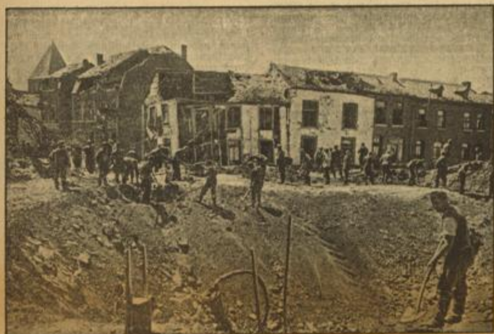
So wirkte eine Stuka-Bombe auf einen belgischen Bahnhof