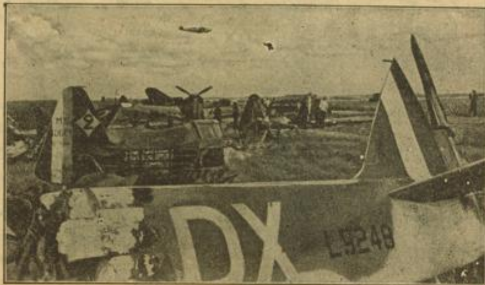
Nur noch Trümmer bedecken den feindlichen Flughafen. Auf einem französischen Feldflughafen, der von unseren Fliegern bombardiert und später von unseren Truppen besetzt wurde: Kein einziges Flugzeug blieb hier unbeschädigt, die meisten wurden am Boden zerstört.