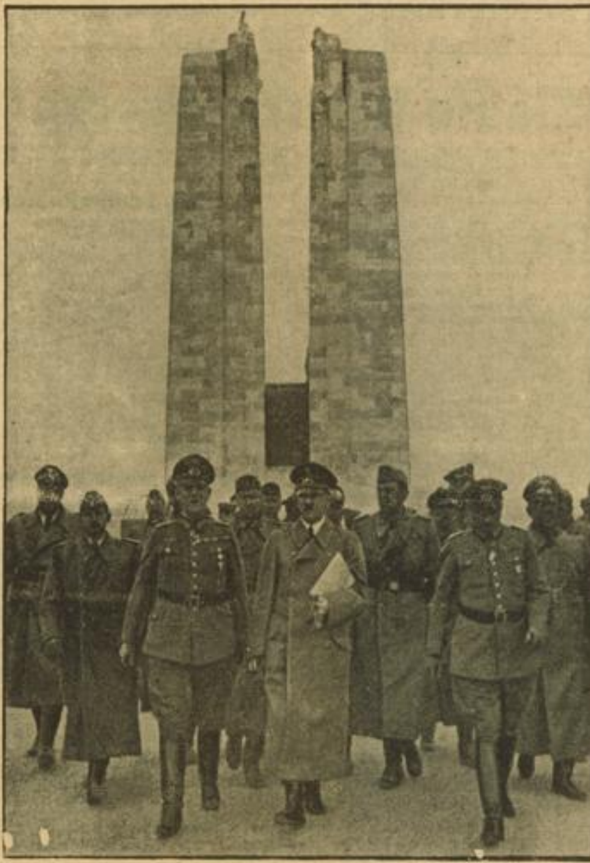
Der Führer am 2. Juni auf der Vimy-Höhe.

Wick auf das Rathaus von Calais, vor dem ein Pak geschützt in Stellung gezogen ist.