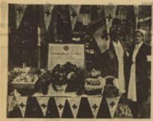
Ein Marktstand, an dem nicht gekauft werden kann, der aber trotzdem nicht übersehen werden darf.