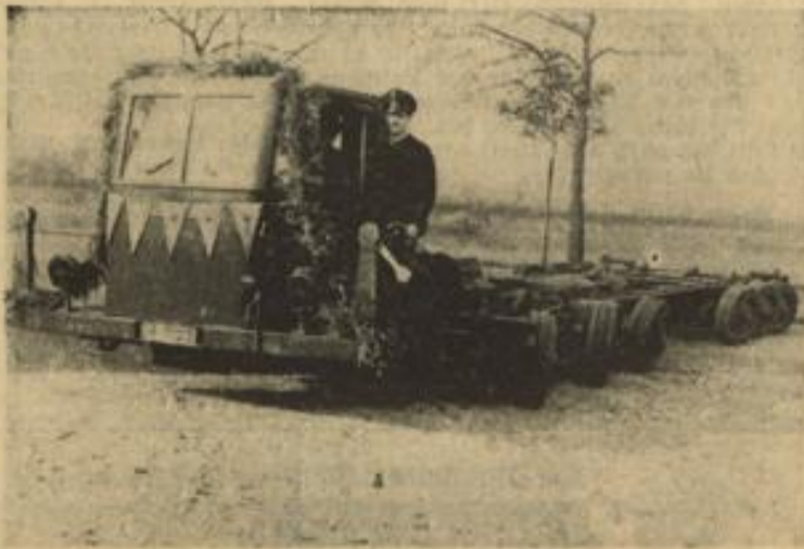
Aufn. Walter Kirubes (2)