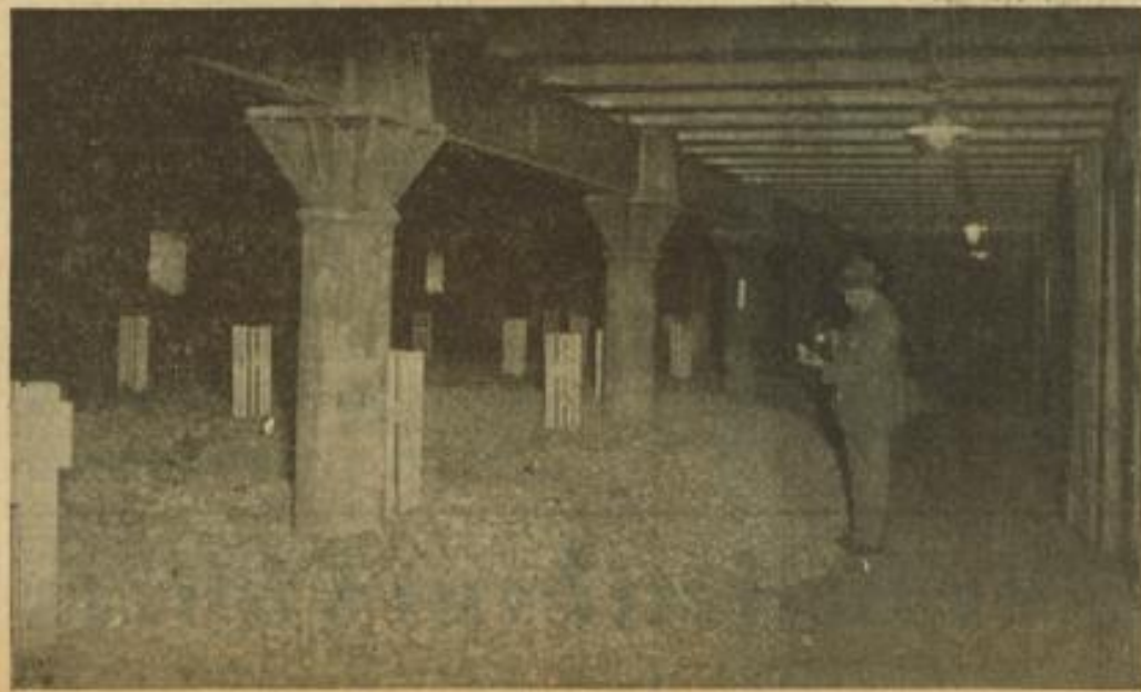
Blick in eines der Mannheimer Kartoffelager

Samstagnachmittag vor der Hauptpost. Hier kapperte bekanntlich der Kreisleiter mit der Büchse. „Wer noch nicht hatte“, kam nicht unbehelligt vorbei. Der Zeitungsvorfänger rief die Schlagzeilen der Abendblätter. Der Mann mit der Büchse hielt wacker mit. Das brachte Leben ins Haus. Die Münzen rollten und die Bomben und Granaten sahen. Da kam die Überraschung: eine scharfe Handgranate in der Hand des Kreisleiters? Es schien so. Oder war es eine geballte Ladung? Das weniger. Es war eine Handgranate, gefüllt mit den nichtexplodierenden Geschossen, wie wir sie alle ansetzen haben. „Zapperloitt, wenn das Ding losginge!“ Es ging los, das Ding — und zwar an den Meistbietenden. „Zum ersten zum zweiten und zum...“ Durch den Schlag der Büchse zwangte sich der „Kaufpreis“. Die Zielhandgranate wird zweifellos das Zielstück in der WHW-Abzeichen-Sammlung sein. Und heute geht's weiter!