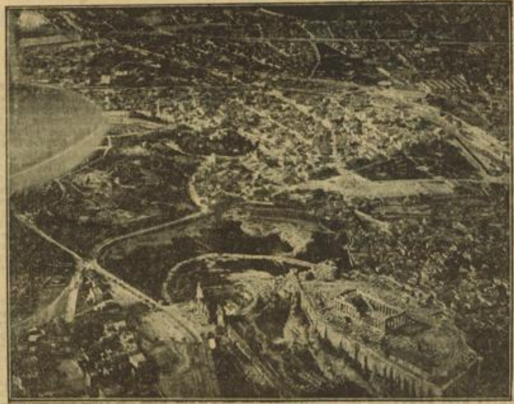
Luftübersicht über Athen

Die Auszeichnungen wurden im Laufe der vergangenen Woche von den zuständigen Amtschefs des Oberkommandos der Kriegsmarine beziehungsweise der Inspektoren der Rüstungsinspektionen bei feierlichen Betriebsappellen überreicht. — Hierbei wurden den mit dem Kriegsverdienstkreuz ausgezeichneten Betriebsführern, Angestellten, Weisern und Arbeitern eine Anerkennung für die bisserigen Leistungen und besondere Dank und die Anerkennung des Oberbefehlshabers der Kriegsmarine übermittelt. Gleichzeitig wurde zum Ausdruck gebracht, daß diese Auszeichnung nicht nur dem einzelnen gälte, sondern für die gesamte Gefolgschaft eine Anerkennung für die gesamtgesellschaftlichen Leistungen sei. Darüber hinaus soll sie für die Betriebe ein Ansporn sein, durch weitere gemeinschaftliche Höchstleistung die Waffen zum Kampf gegen England für die Kriegsmarine wirksam zu schmieden.