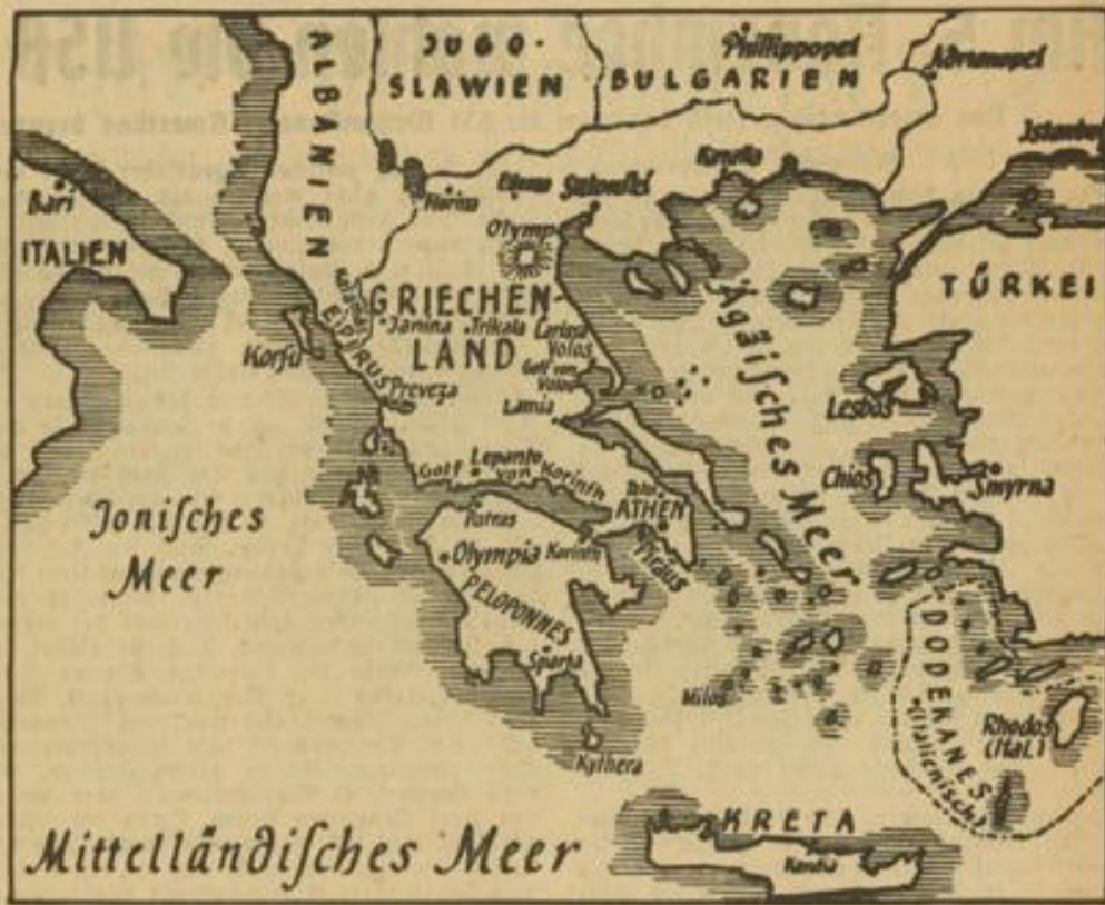
Janina und Florina im Mittelpunkt der italienischen Angriffsaktionen

Der Versuch, englische Luftstreitkräfte in Ägypten, die sich immer beträchtlicher auswirkenden Bombardierungen Marfa Matrük durch den Einsatz englischer Jagdstaffeln zu verbindern, hat, wie der italienische Wehrmachtbericht feststellt, zu dem Abschub von 17 englischen Jägern geführt. Alle Abschüsse ereigneten sich bei einer im großen Stil von italienischen Verbänden vorgenommenen Bombardierung englischer Stützpunkte in Ägypten.