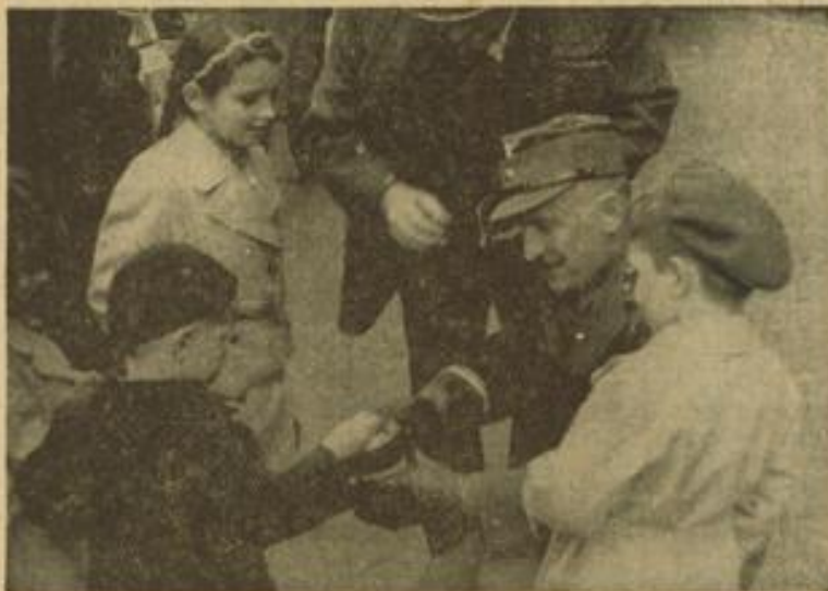
Auch die Jüngsten brachten ihr Scherlein. Lachend kultivierte unser Kreisleiter. Rechts: Das Segelfluggzeug am Paradeplatz wurde gebührend bewundert.

Munition, die Geld einbringt / Streiflichter von der dritten Kriegs-WH-W-Straßenfammlung