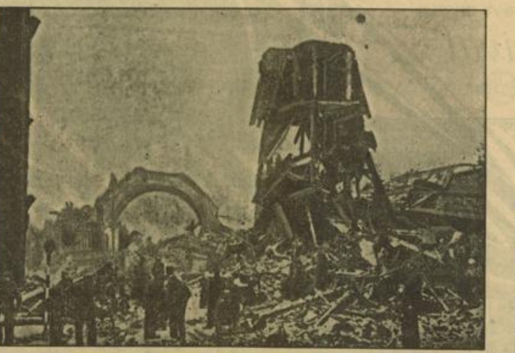
So schlägt die deutsche Luftwaffe zu! Immer wieder setzt die deutsche Luftwaffe ihre Vergeltungsangriffe gegen kriegswichtige Ziele in London fort...