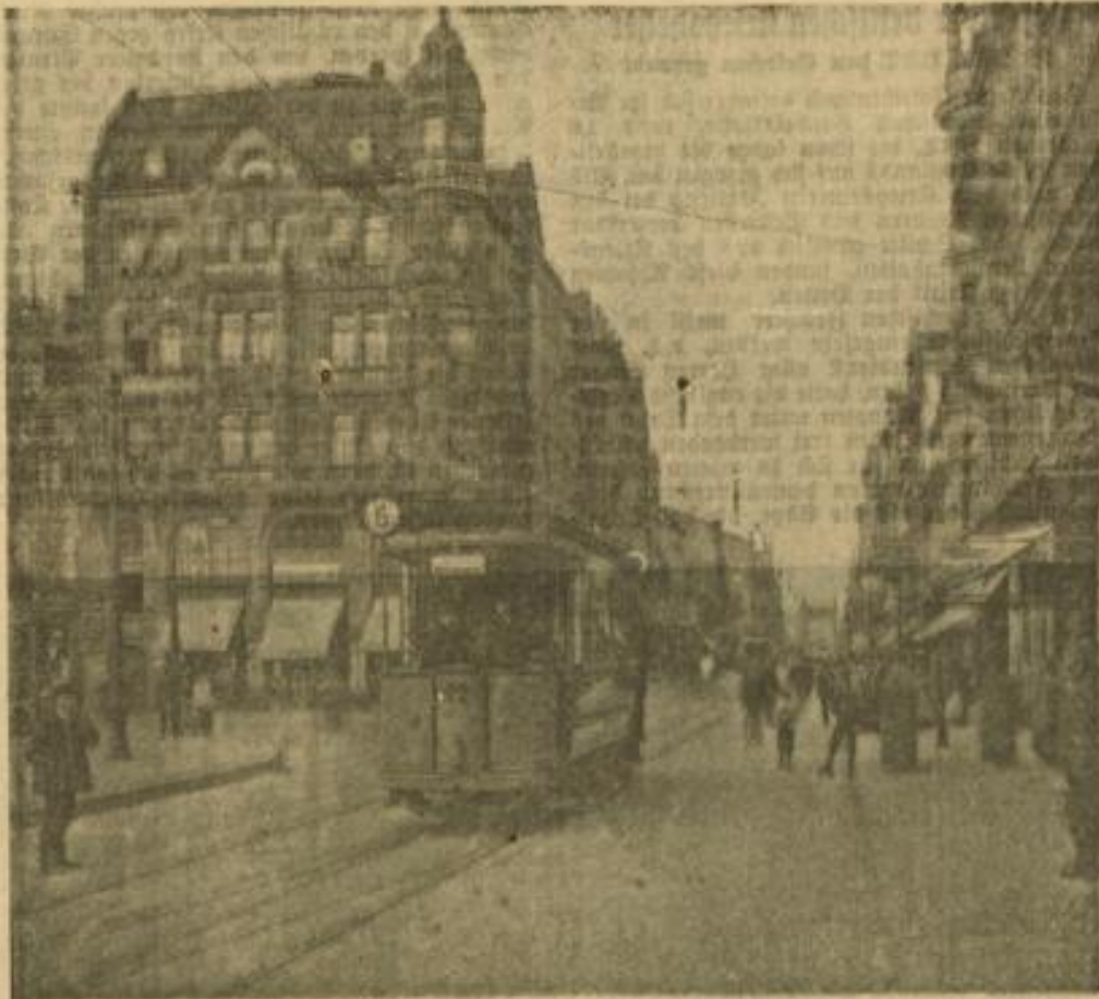
Diese Aufnahme aus dem Jahre 1910 zeigt einen der ersten Mannheimer Straßenbahnwagen, wie sie noch bis ungefähr zum Weltkrieg in Betrieb waren.