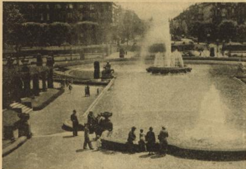
Mannheims schönster Platz

„Am Gegensatz dazu, daß es bisher gestattet war?“