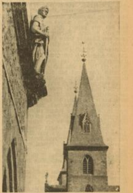
Das deutsche Anflitz Luxemburgs