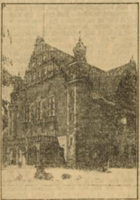
Eröffnung der Reichsuniversität Posen