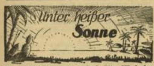
Ein Libyen-Roman von Carl Otto Windecker

Von den zuständigen Stellen des Arbeitsamtes Mannheim, der Kreisbauernschaft und des Jugendamtes wurde in der Schützenhalle eine Berufsberatung für die zur Entlassung kommenden Schüler abgehalten. Ihr kommt gerade hier besondere Bedeutung zu, weil eine blühende Landwirtschaft vorhanden ist und auf den Zugang junger Kräfte für die Landwirtschaft mit Recht großer Wert gelegt wird.