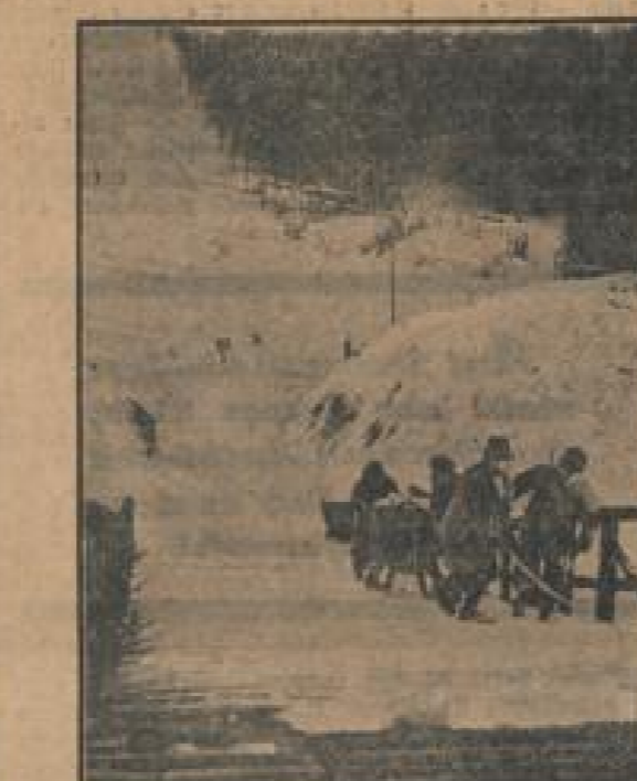
Der Reiter führt den Reiter auf die Stätte der Wintersportspiele in Braunlage...