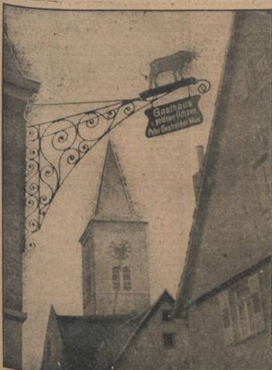
Symbol des Schriesheimer „Goldenen Ochsen“

A propos „Bod.“ Die Wirtse sind auf die originellsten und oft ausgefallenen Namen für ihre Gaststätten verfallen. Waren diese im Mittelalter derbe und bestig, wie „Lechter Keller“, „In den fetten Därmen“, „Blauer Donner“, „Blauer Mann“, so kamen immer, dem Zeltachmad Rechnung tragend, in späteren Jahren andere Benennungen auf. Besonders