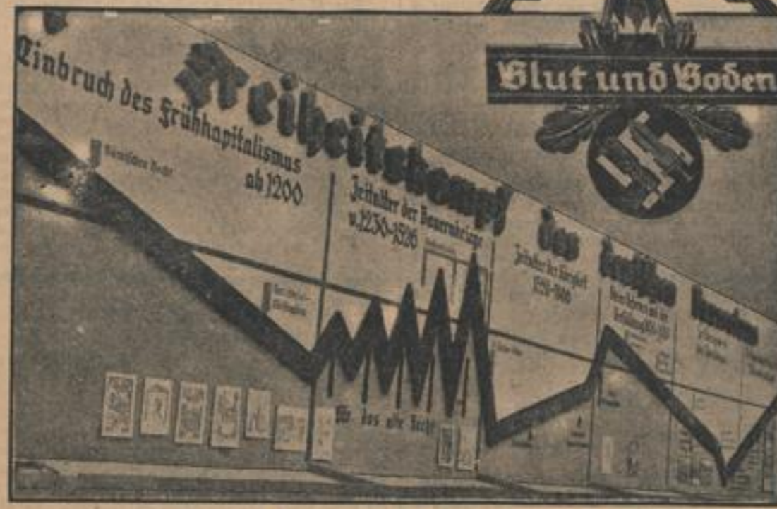
Eine interessante Darstellung auf der Berliner „Grünen Woche“