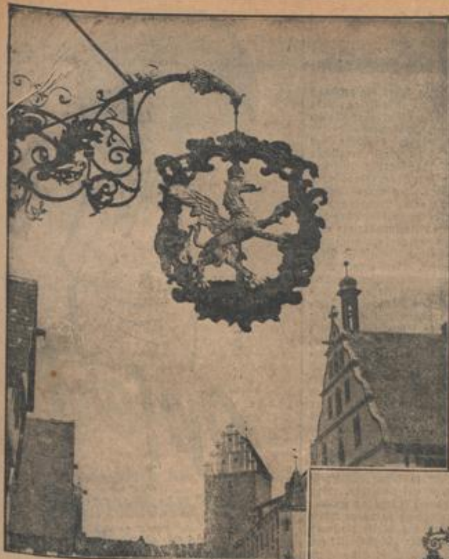
Das Schild vom „Greifen“ in Dinkelsbühl

Es ist für den Wanderer, der aus norddeutschen Landen kommt, etwas Schönes, Sinnfälliges, wenn er in den kleinen süddeutschen Städten, in den malerischen Dörfern, besonders in Baden, an den Türen altertümlicher Wirtshäuser ein geschmiedetes eisernes Sinnbild edelsten Trunks bemerkt, das vom Wetter und vom Wind im Laufe vieler Jahrzehnte wohl etwas um seinen Glanz, aber nie um den wahrhaft schonen Schwung seiner Linien gekommen ist.