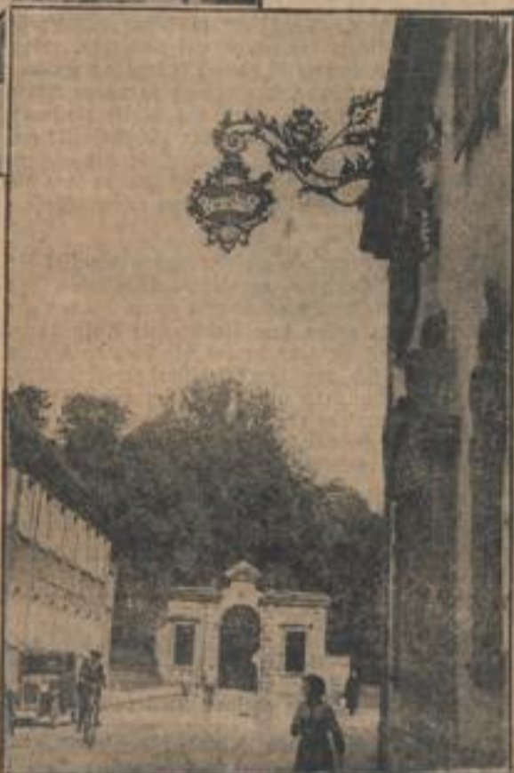
Das prächtige Schild des Rastatter „Braustübl“

Gründlich ist es erst ein Jahrhundert her, daß man in den Städten und ländlichen Ortschaften die Nummerierung der Häuser eingeführt hat.