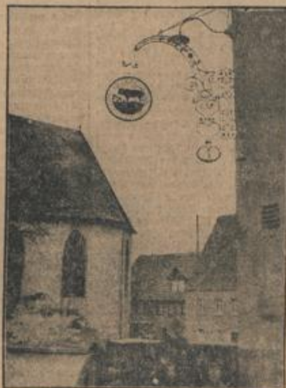
Der Hirschborner „Ochse“