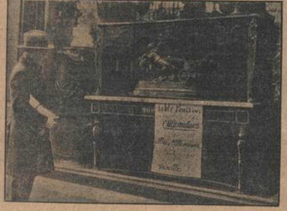
Der historische Tisch.

auf dem von den Delegierten der alliierten Mächte im Jahre 1919 das Ultimatum an Deutschland zur Annahme der Friedensbedingungen unterzeichnet wurde, ist jetzt bei einem Berliner Antiquitätenhändler zum Verkauf ausgestellt. Der Händler will sich offenbar die historische Bedeutung des Tisches besonders bewahren lassen.