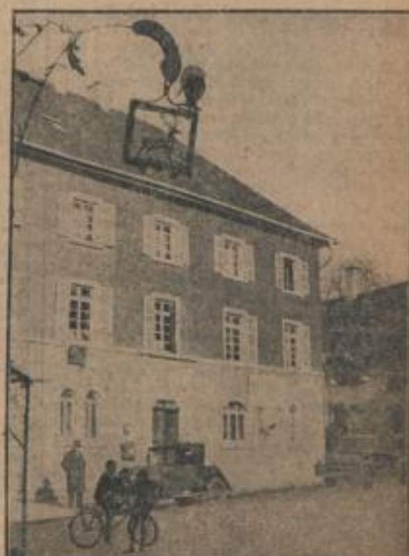
Der „Hirsch“ in Bad Rappena