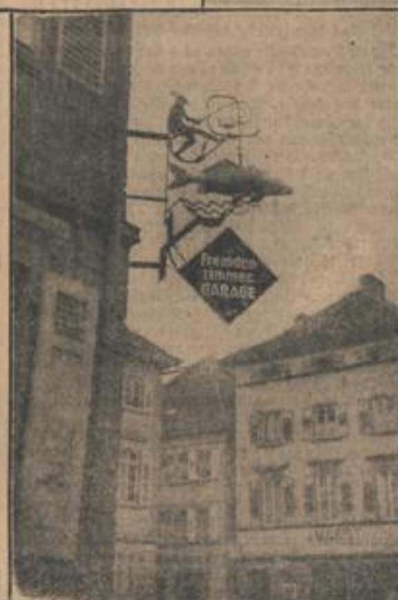
Der „Karpfen“ in Neckargemünd

Mit dem Wachstum der Städte aber wurde das Finden von Einzelpersonen und Familien immer schwieriger. So entstand die Nummerierung der Häuser. Aber lange vor der Nummerierung eines jeden Han-