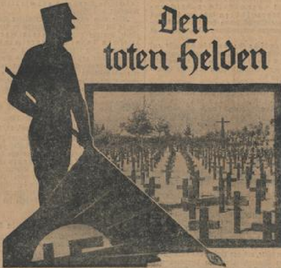
Das neue Deutschland erbt die Taten der alten Arme...