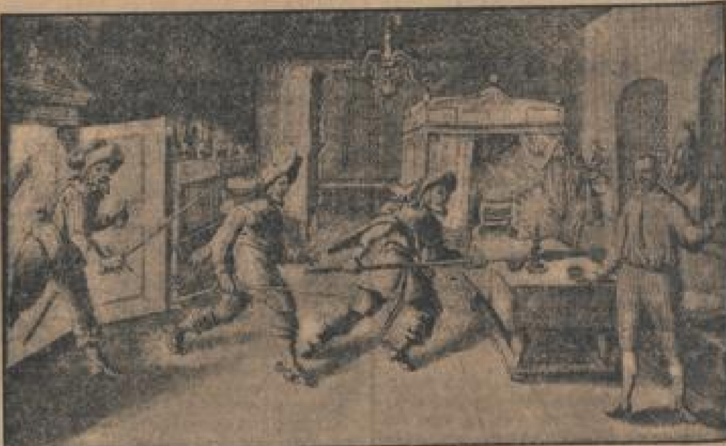
Wallenstein's Lager im Stadthaus von Oger nach einer zeitgenössischen Darstellung.