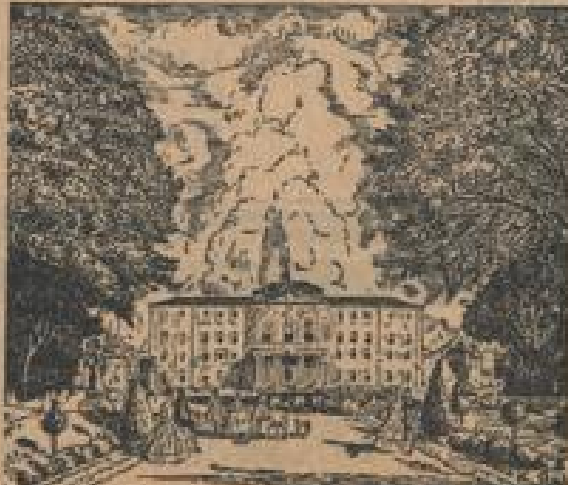
Das prächtige Schloß von der Gartenfeste

auch die Wiedererrichtung der Karnevalsgesellschaft und dann die Abhaltung eines Schloßwertfestes, und zwar unter Mitwirkung der Kinder.